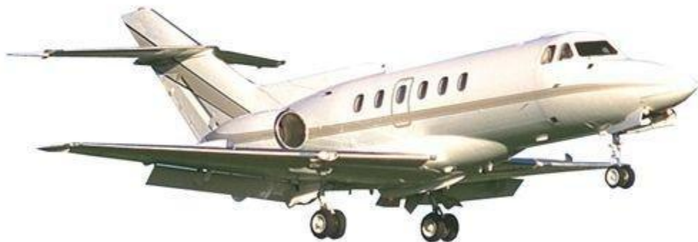
Объект самолет прототип или оригинал

Метод познания окружающего мира, состоящий в создании и исследовании «заместителей» реальных объектов, называемых моделями.