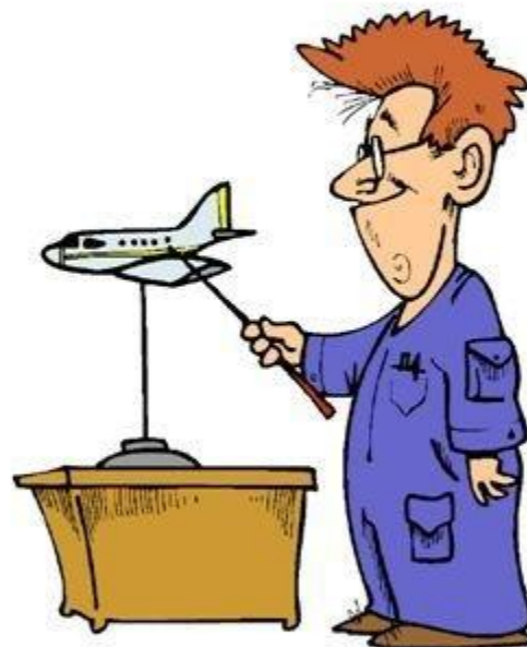
«заместитель» объекта самолет модель