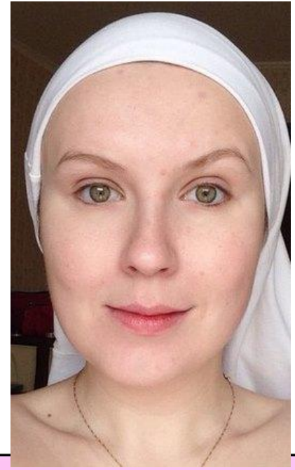
Warm Pastel Pink