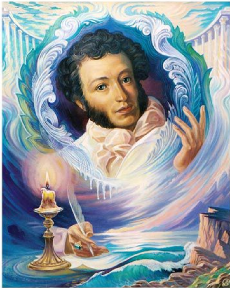
"Российского Престола Пленник" © Художник В. Суворов

Это стихотворение было написано Пушкиным очень быстро, в течение одного дня (3 ноября 1829 года) в имени своих друзей Вульфов.