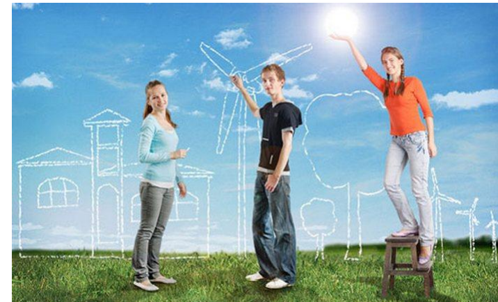
Схема социального проектирования

Проект – это предположительные действия, которые будут совершены в направлении темы проекта. Проект может существовать в любой сфере деятельности человека.