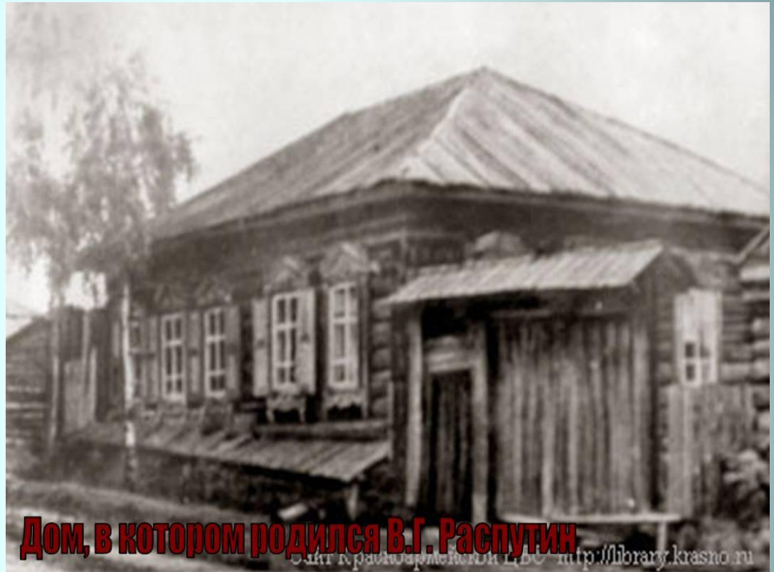
Дом, в котором родился В.Г. Распутин

После школы поступил на историко- филологический факультет Иркутского университета. В студенческие годы стал внештатным корреспондентом молодежной газеты.