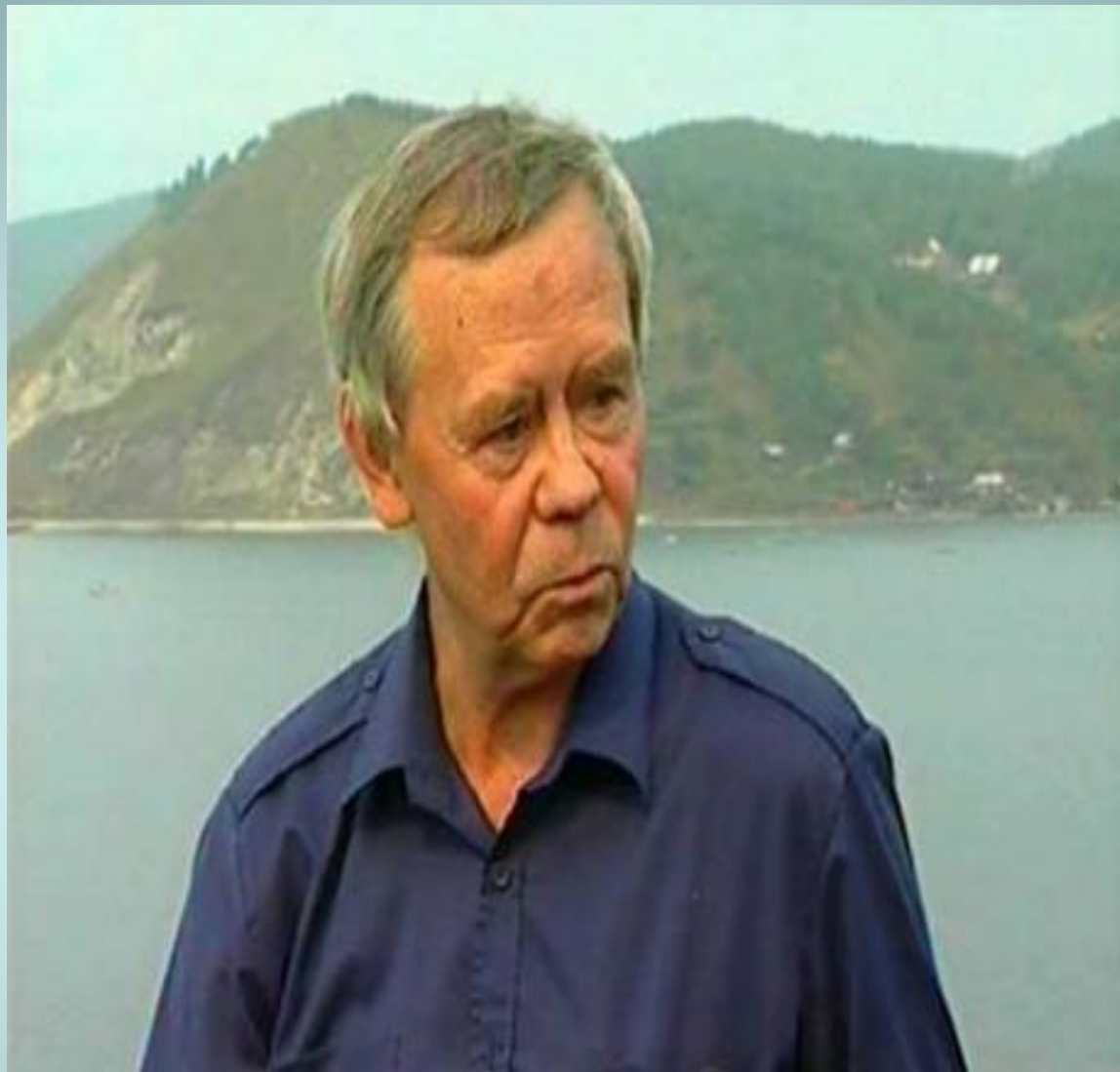
Валентин Григорьевич Распутин