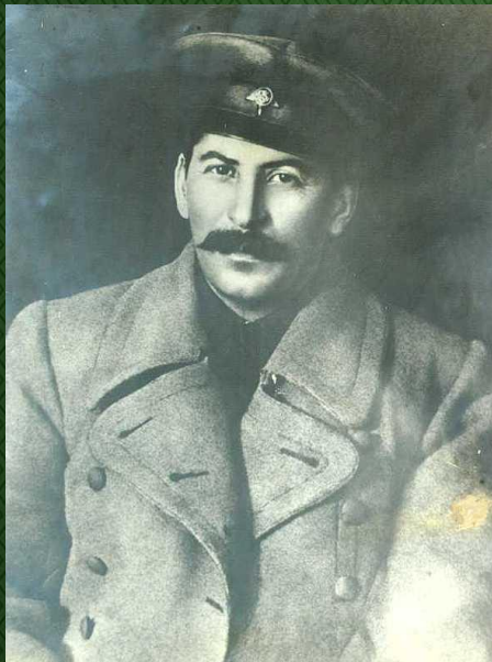
Член РВСР Иосиф Сталин 1919