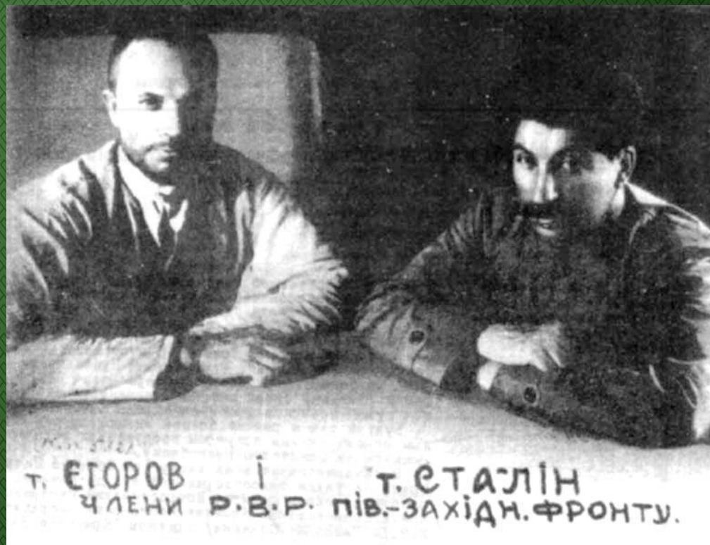
И. В. Сталин - член ЦК РКП(б). 1920 год.