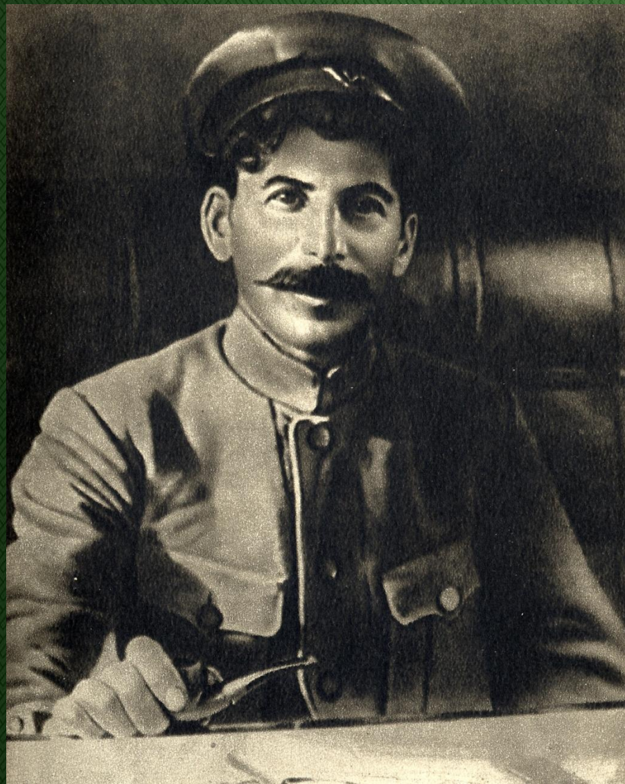
И.В. Сталин нарком по делам национальностей. 1917 году