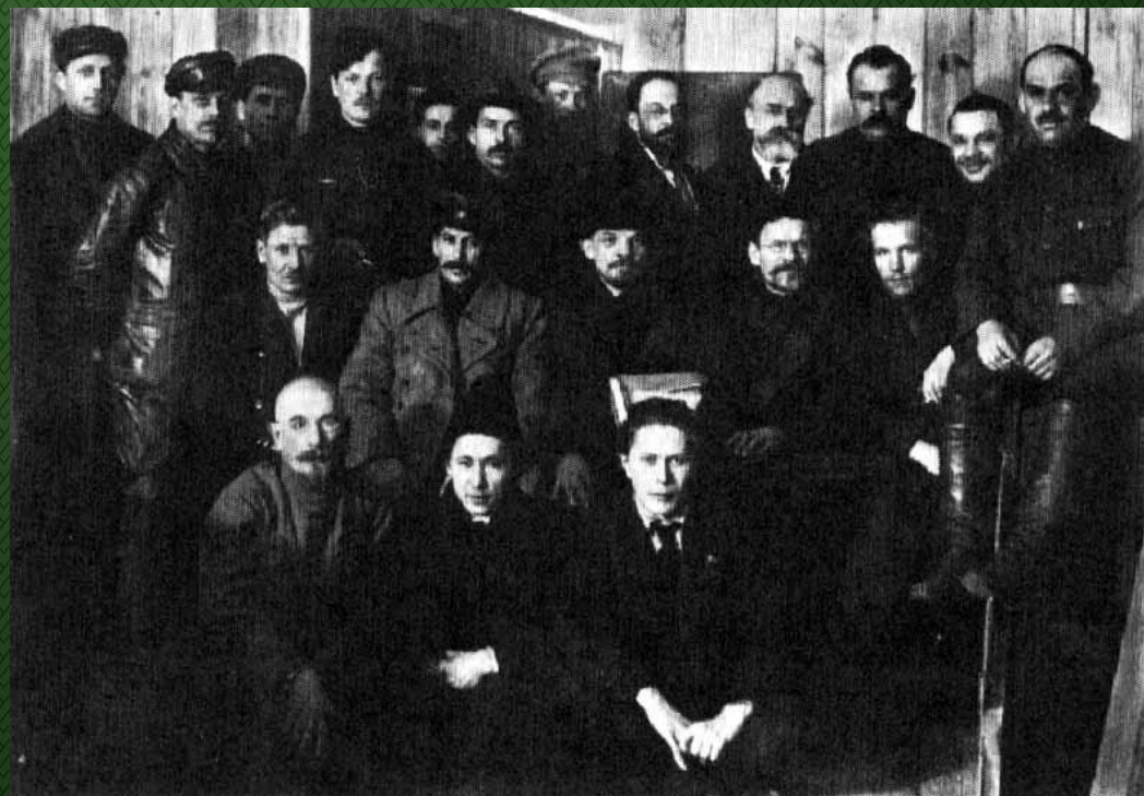
Ленин и Сталин среди делегатов VIII съезда. Март 1919 г.