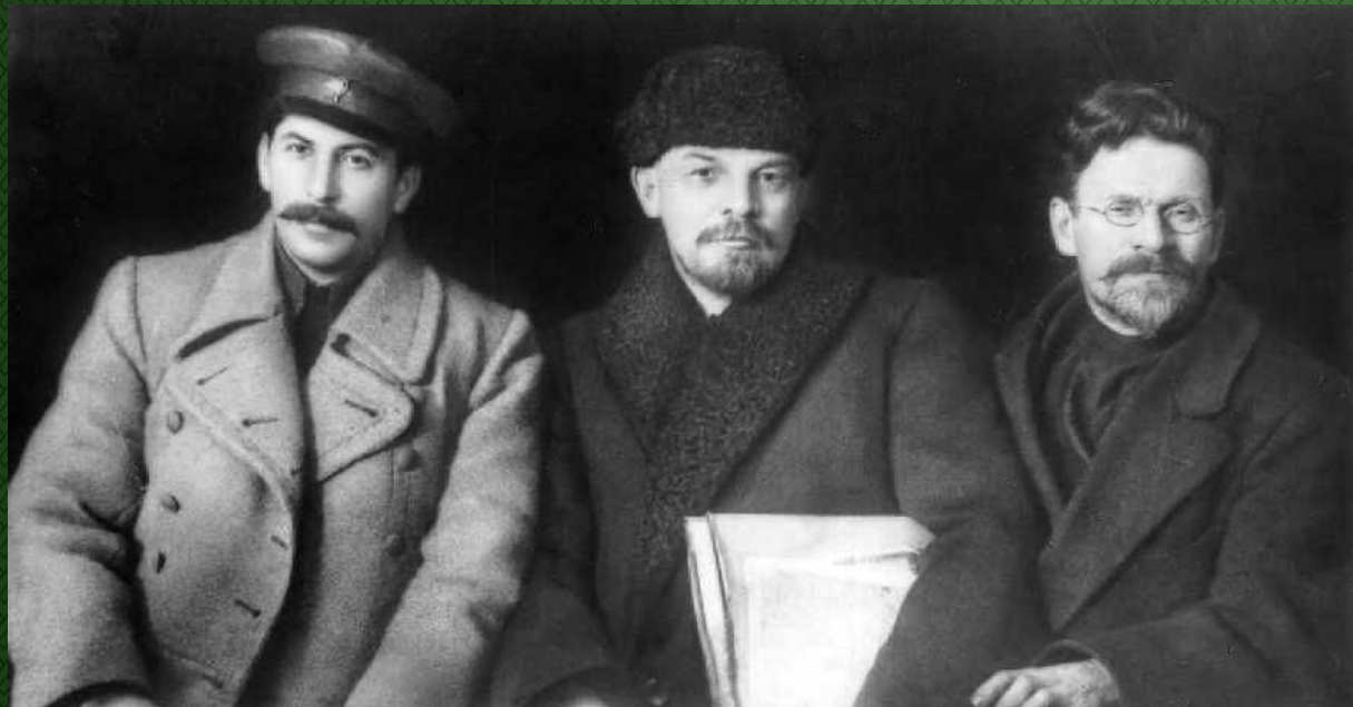
Сталин, Ленин и Калинин на VIII съезде РКП(б). Март 1919 г.