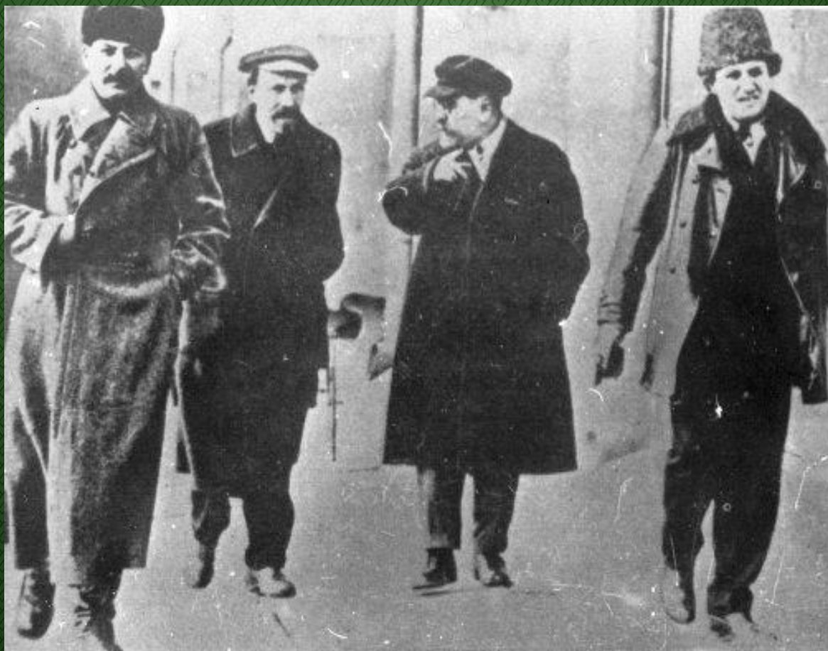
И. Сталин, А. Рыков, Л. Каменев и Г. Зиновьев . Петроград. Смольный. 1917 год