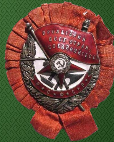
Постановление ВЦИК от 20 ноября 1919 года, Приказ РВСР № 383

После начала гражданской войны Сталин был командирован на юг России в качестве чрезвычайного уполномоченного ВЦИК по заготовке и вывозу хлеба с Северного Кавказа в промышленные центры. Прибыв 6 июня 1918 года в Царицын, Сталин взял в свои руки власть в городе, занялся обороной Царицына от войск атамана Краснова. Однако первые же военные мероприятия, предпринятые Сталиным совместно с Ворошиловым, обернулись поражениями Красной Армии. Обвинив в этих поражениях «военспецов», Сталин произвёл массовые аресты и расстрелы. После того, как Краснов вплотную подошёл к городу и полублокировал его, Сталин был отозван из Царицына по решительному настоянию Троцкого. Вскоре после отъезда Сталина город пал. Ленин осудил Сталина за расстрелы.