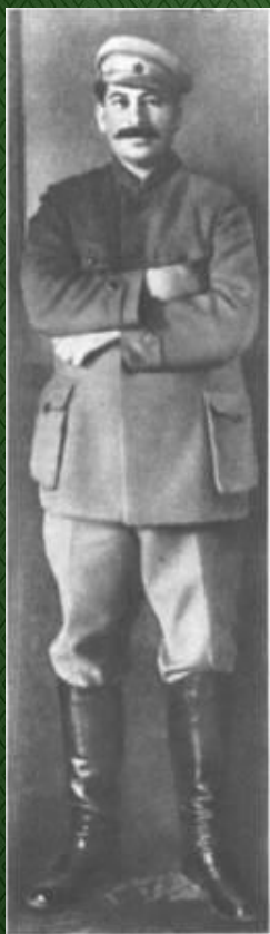
Сталин 1920 г.