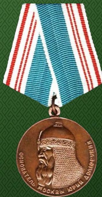
Юбилейная медаль «XX лет Рабоче-Крестьянской Красной Армии». 1938 Медаль «В память 800-летия Москвы». сентябрь 1947