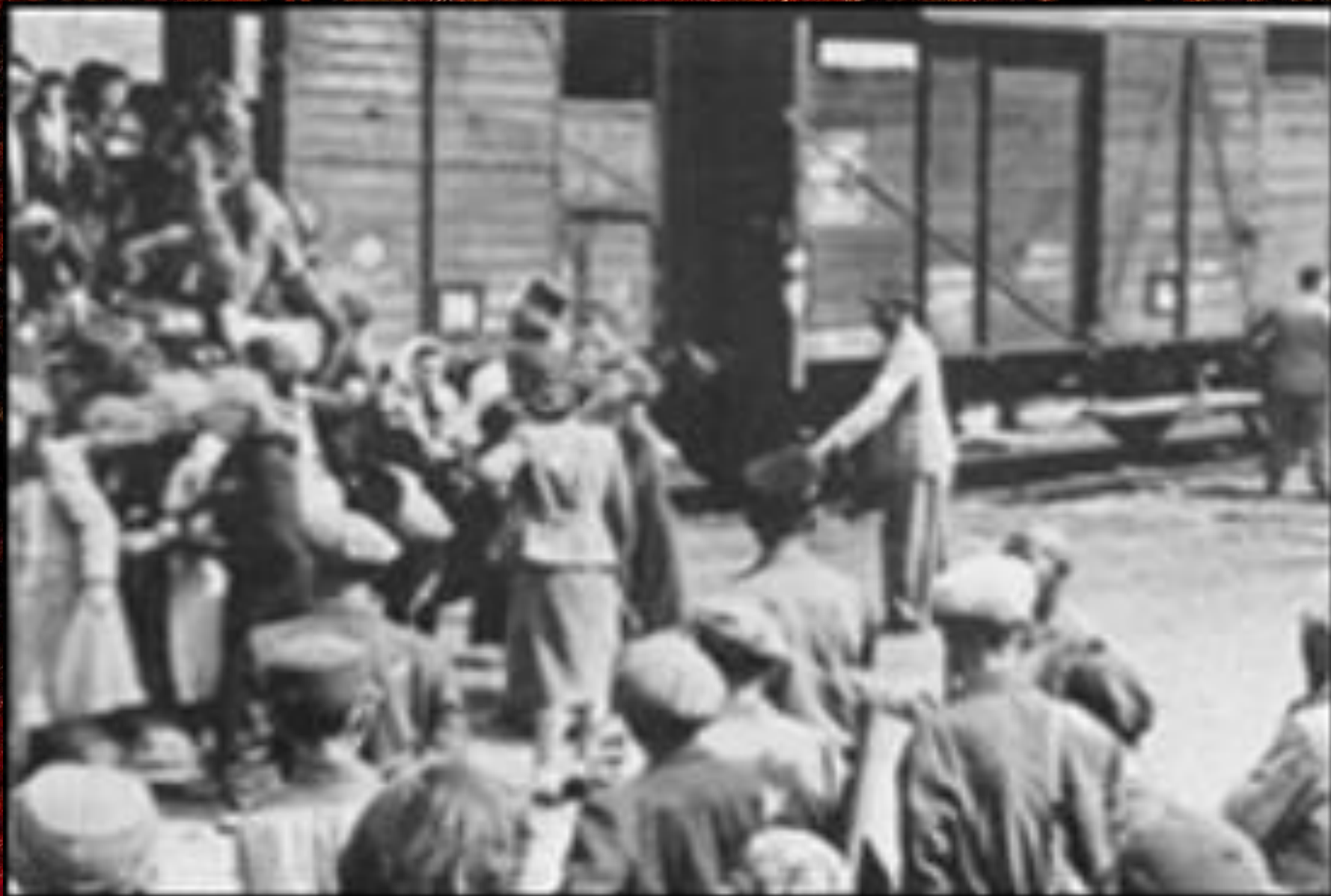
Депортация чеченцев и ингушей.