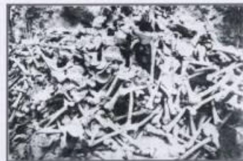
Фото 14 – ОСТРОВКИ (OSTROWKI) и ВОЛА ОСТРОВИЦКА (WOLA OSTROWIECKA), уезд Лобовин, повстанчество летнее Август 1992

Результат проведенной 17 – 22 августа 1992 года массовой расчистки территории, расположенной в районе Островки и Воля Островицка, совершённой террористами ОУН – УПА (OUN – UPA). Украинские источники из Киева с 1988 года сообщают об общей количестве жертв в двух перечисленных селах 2 000 человек.