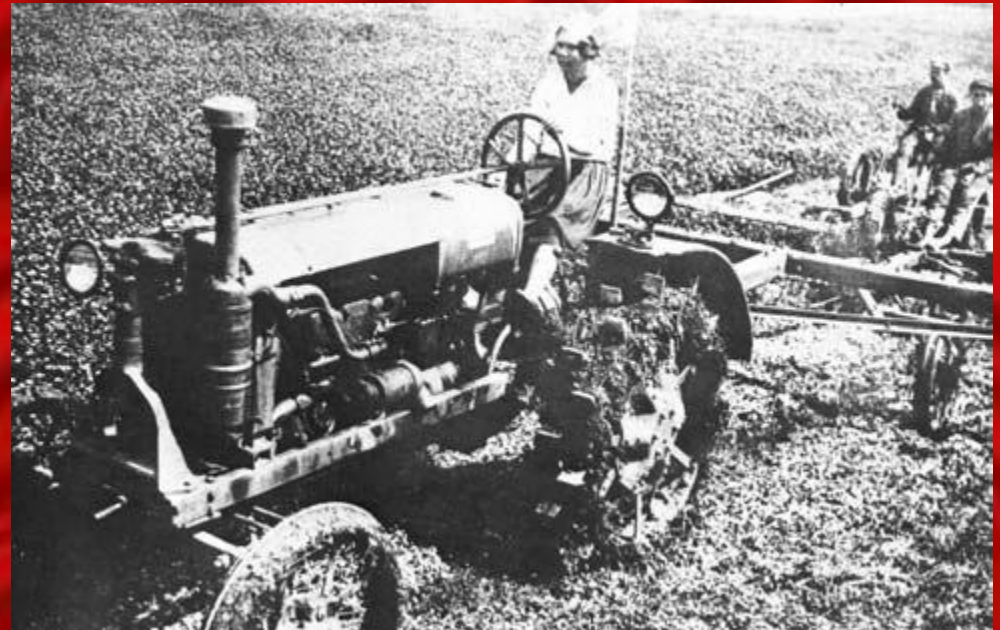
Жінка на тракторі