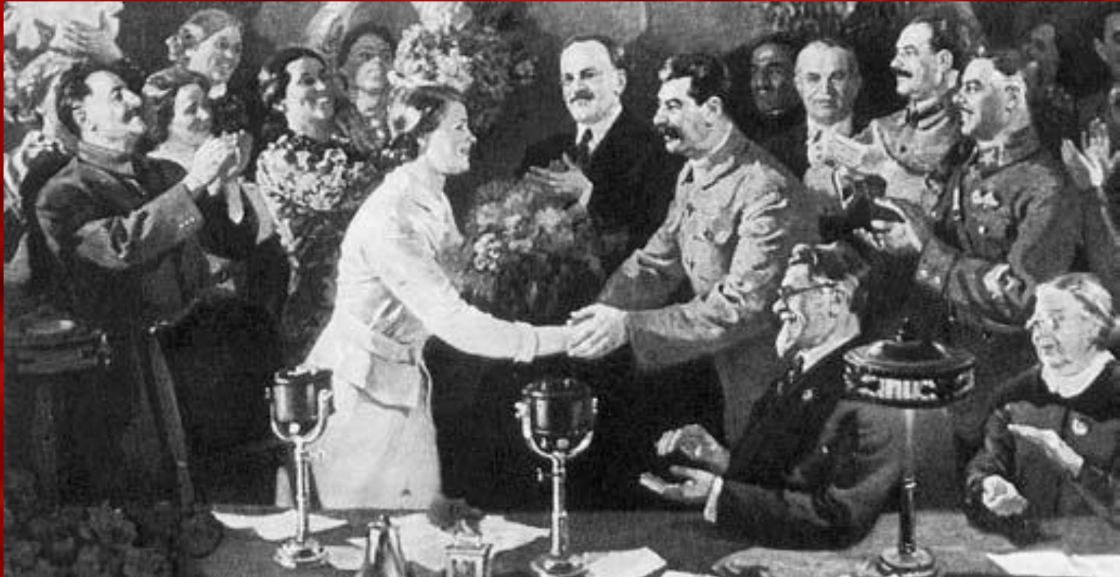
Картина невідомого художника «Незабутній момент»

Віра в обіцяний комуністами ідеальний світ надихала маси на гігантські практичні звершення