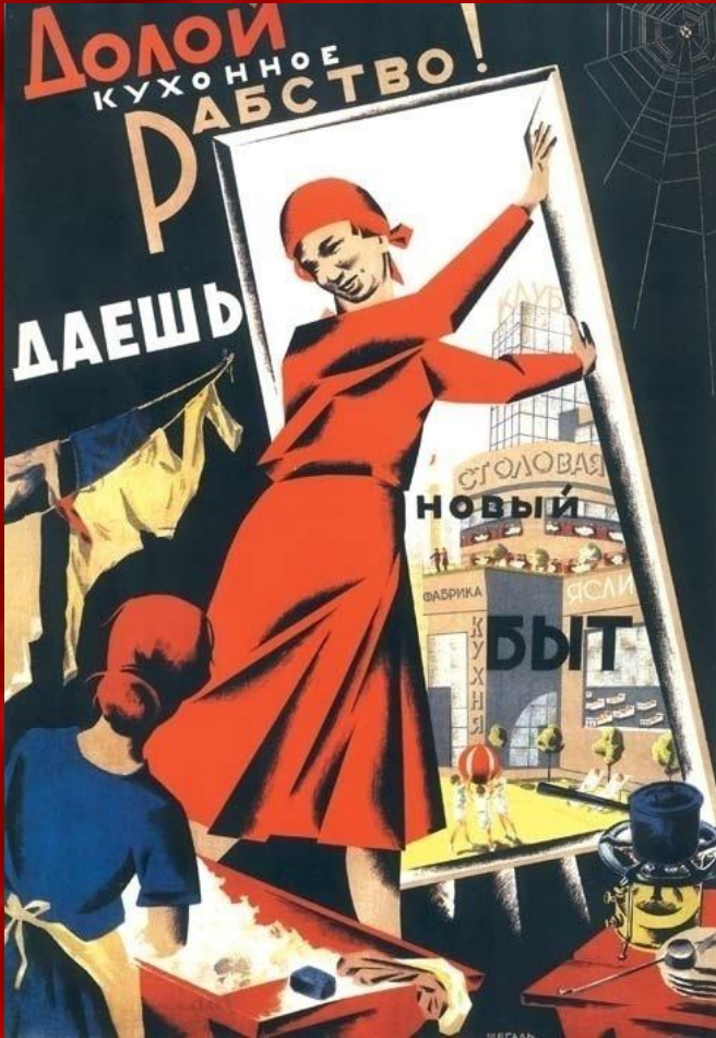
Радянський плакат 1932 р.

В СРСР було проголошено: «Працююча жінка – активний будівник соціалізму.»