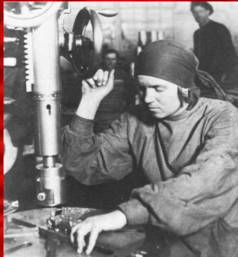
Жінка-токар. 1930-і роки

Жіночу працю використовували навіть у шахтах