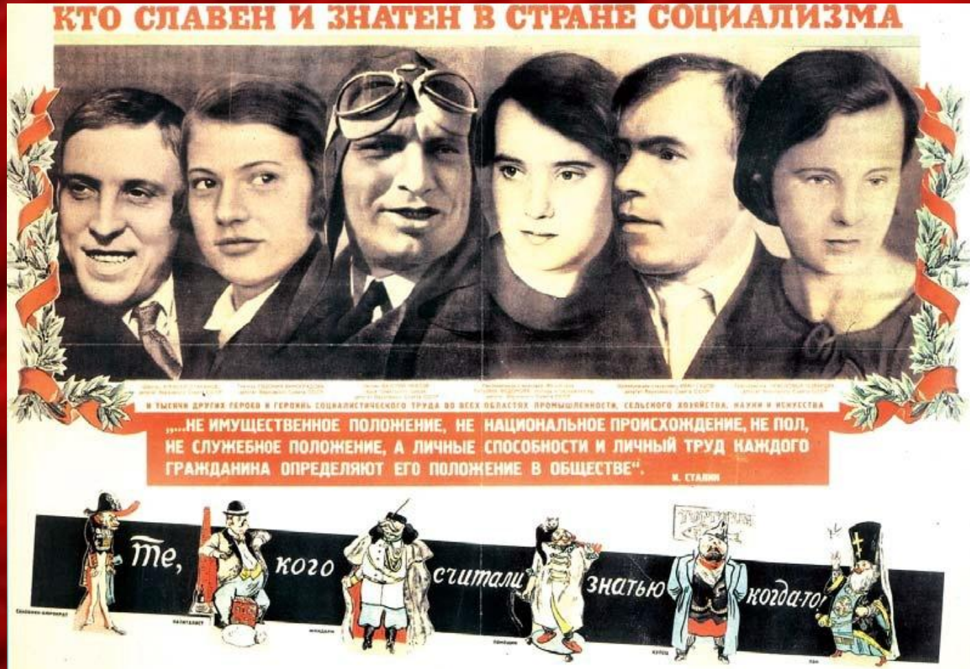
Плакат 1930 р.

Вирішальним фактором у життєвому шляху і кар'єрі було соціальне або класове походження людини