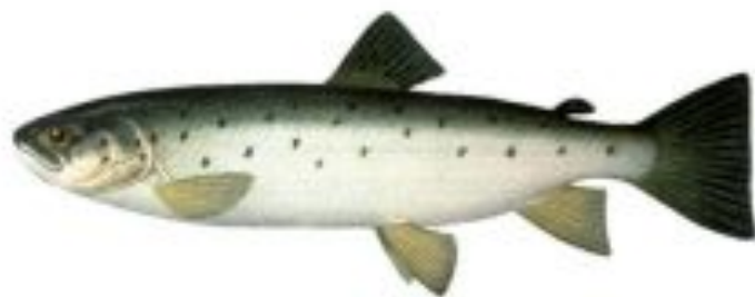
Фото 5. Сванская форель нипхан.