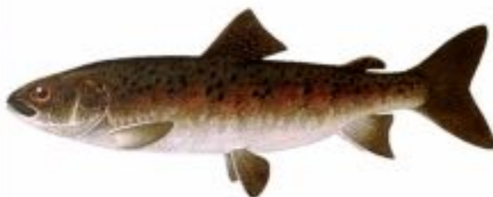
Фото 20. Ленок.