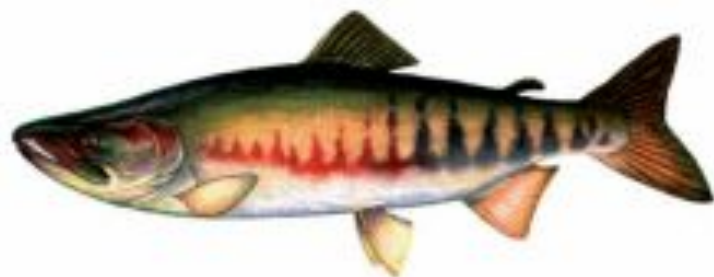
Фото 9. Кета.