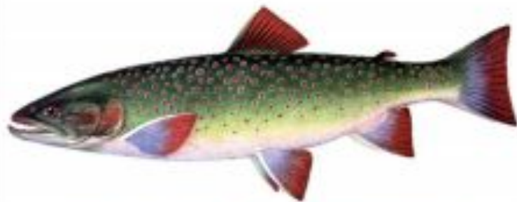
Фото 17. Мальма, тихоокеанский голец (самец в брачном наряде).