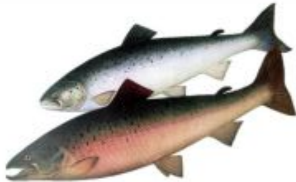
Фото 1. Лосось, семга (сверху – самка, внизу – самец в брачном наряде).