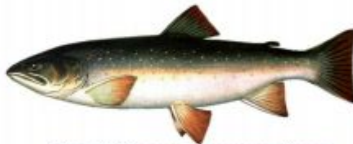
Фото 18. Мальма, тихоокеанский голец (серебрянка).