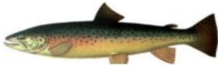
Фото 2. Кумжа.