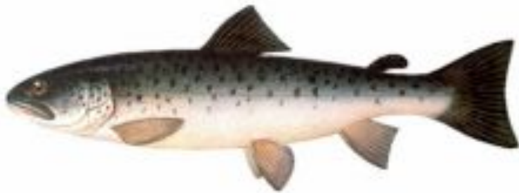
Фото 3. Озерная форель.