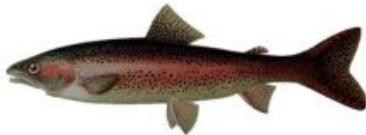
Фото 4. Радужная форель.