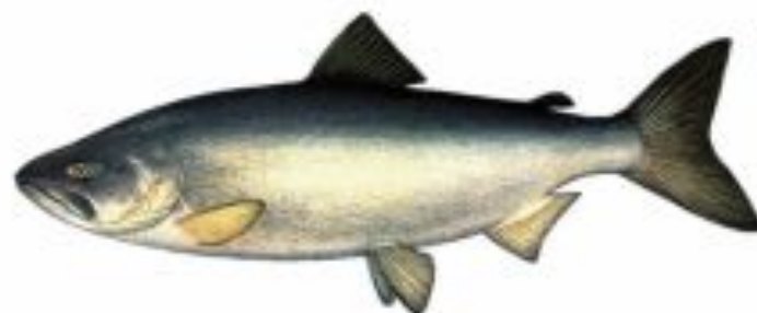
Фото 10. Кета (серебрянка).