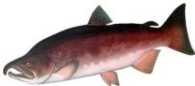
Фото 11. Кижуч (самец в брачном наряде).