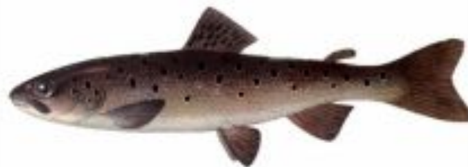
Фото 6. Сванская форель летний бахтач.