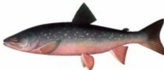
Фото 16. Писня.