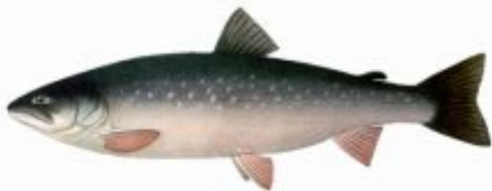
Фото 15. Голц.