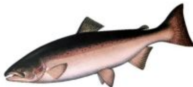
Фото 14. Чавыча в брачном наряде.