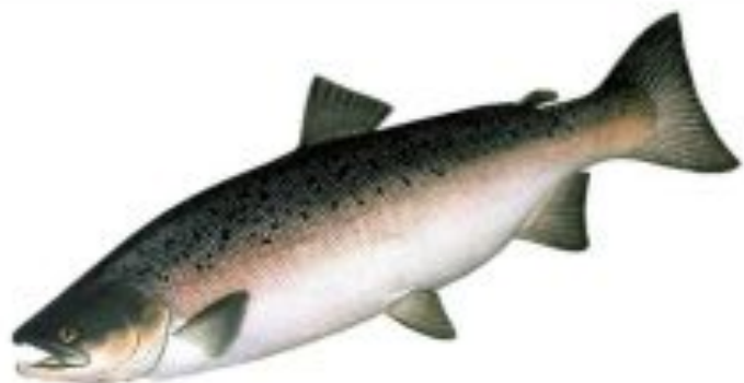
Фото 13. Чавыча (серебрянка).