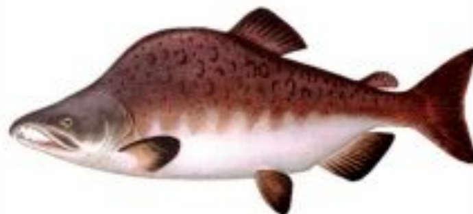
Фото 8. Горбуша (самец в брачном наряде).