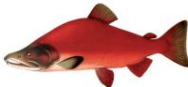
Фото 12. Нерка, красная.