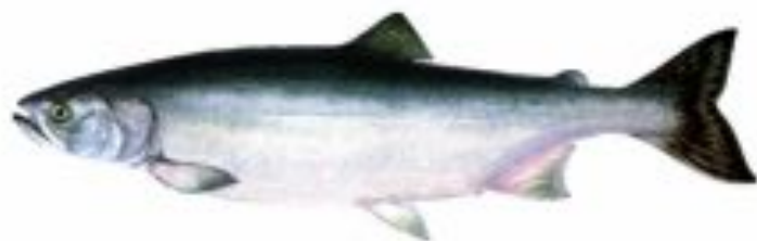
Фото 7. Горбуша (серебряшка).