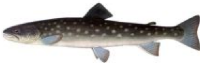
Фото 19. Кузнецка.