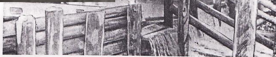
На снимке строительство запруды и пожарного водоема в колхозе «Борьба» осуществляется силами колхозников при активном участии членов ДПД в период подготовки к общественному смотру.