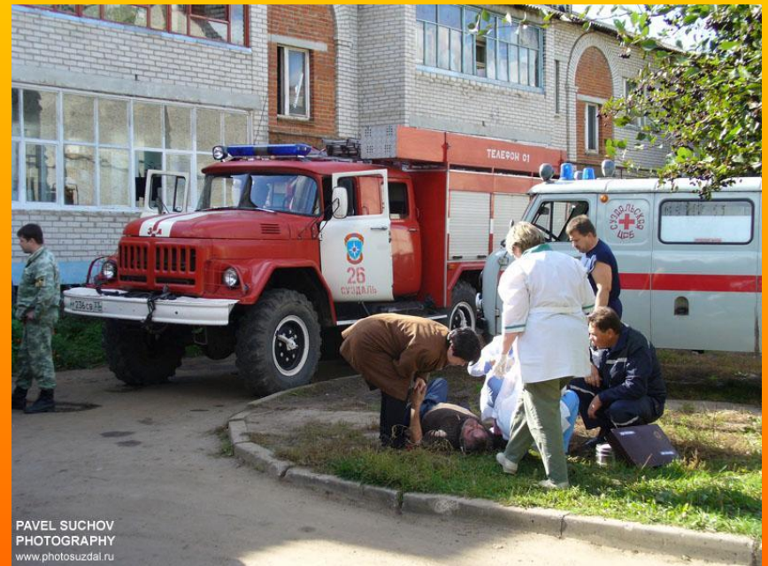
PAVEL SUCHOV PHOTOGRAPHY www.photosuzdal.ru