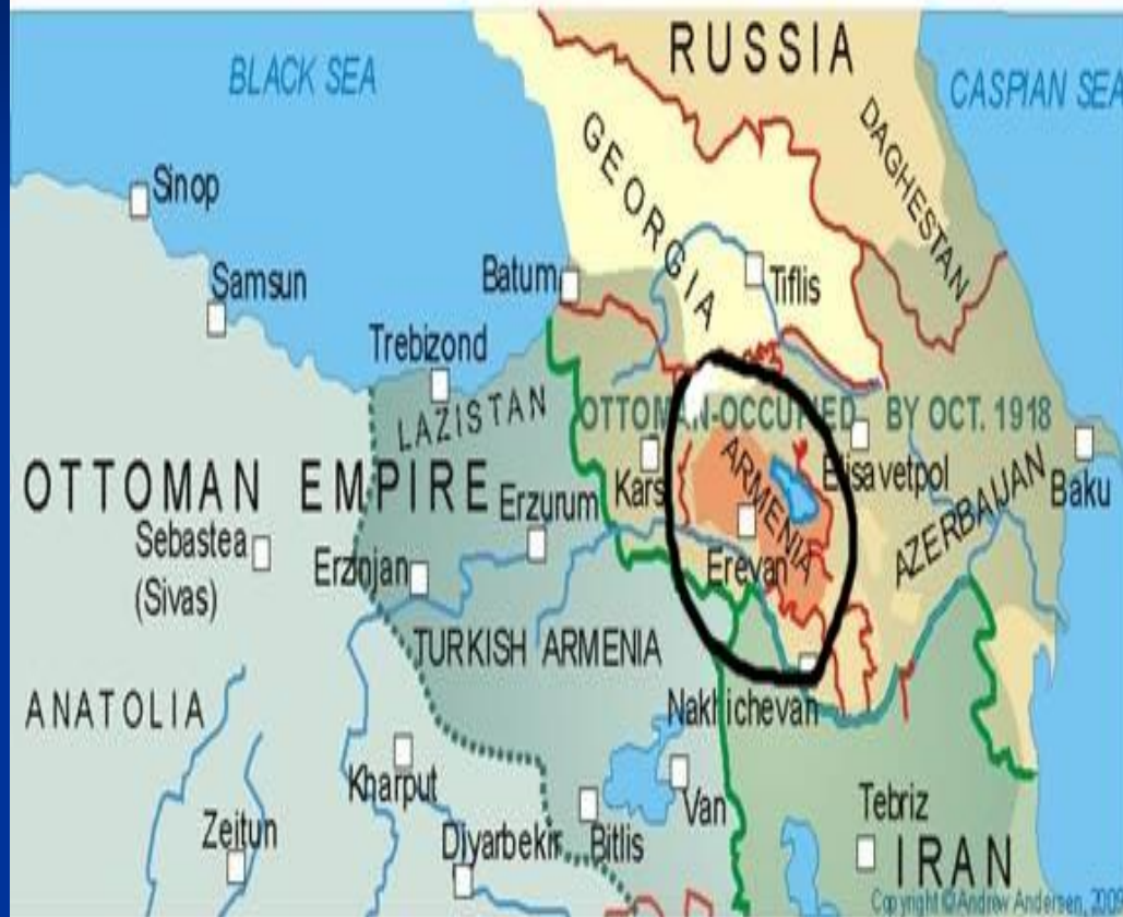
SOUTH CAUCASUS AT THE END OF THE GREAT WAR 1917-1918