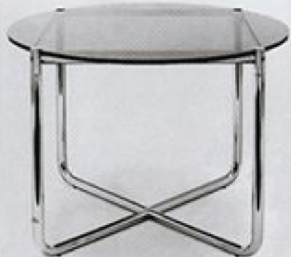
Людвиг Мис-ван-дер-Роз стол, стул, 1927

В выпущенном школой «Манифесте» 1919 года архитектура была названа ведущим направлением в дизайне, провозглашались принципы равенства между прикладными и изящными искусствами, декларировались идеи повышения качества промышленной продукции. Основатели движения видели целью удовлетворение массовых потребностей населения и стремились сделать промышленные товары красивыми, доступными по цене и максимально удобными.