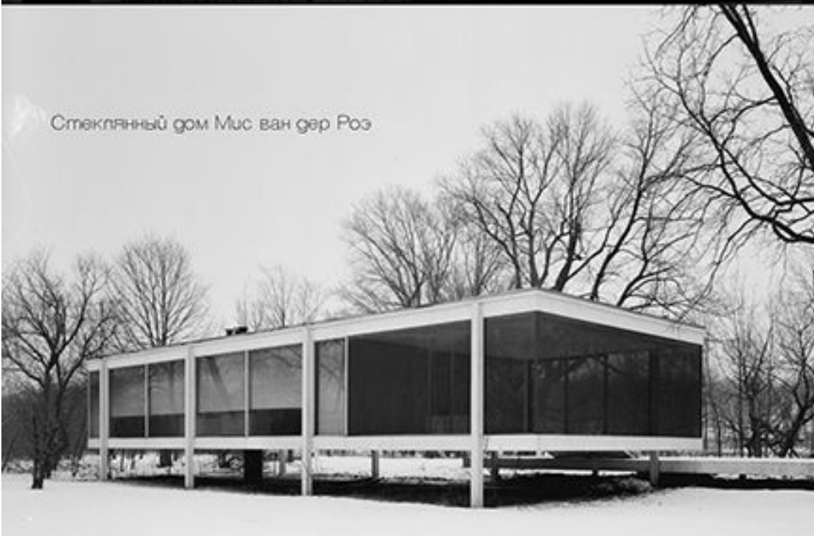
Стеклянный дом Мис ван дер Роз