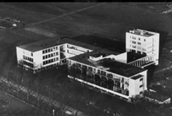
Баухаус в Дессау (Гропиус, 1929)

Школа Баухаус образована в Веймаре 25 апреля 1919 в результате объединения Саксонско-Веймарской Высшей школы изобразительных искусств и основанной Анри Ван де Вельде Саксонско-Веймарской школы прикладного искусства. Руководитель - Вальтер Гропиус