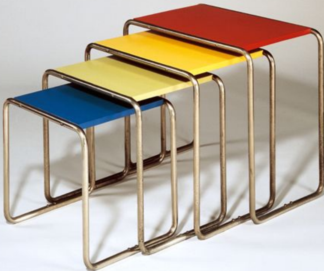
Марсель Бройер (Marcel Breuer) — столики- табуретк и, 1925 год