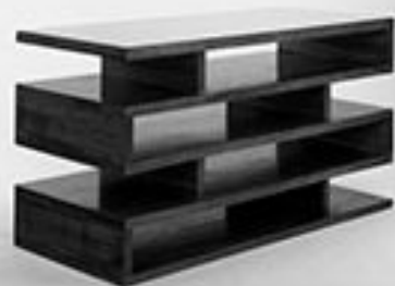
Сигерэмбингине (Мис ван дер Роэ и Филип Джонсон, 1958)

The less is more («чем меньше — тем больше»).