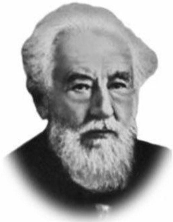
Гуго де Фриз