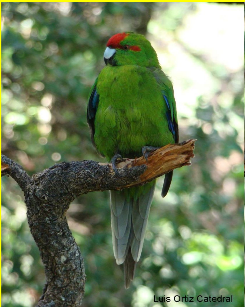
Luis Ortiz Catedral

Какарики обитают в Новой Зеландии, где встречаются в более умеренных широтах. Это чрезвычайно подвижные птицы, которые совершенно необычным образом «бегают» по сетке вольера.