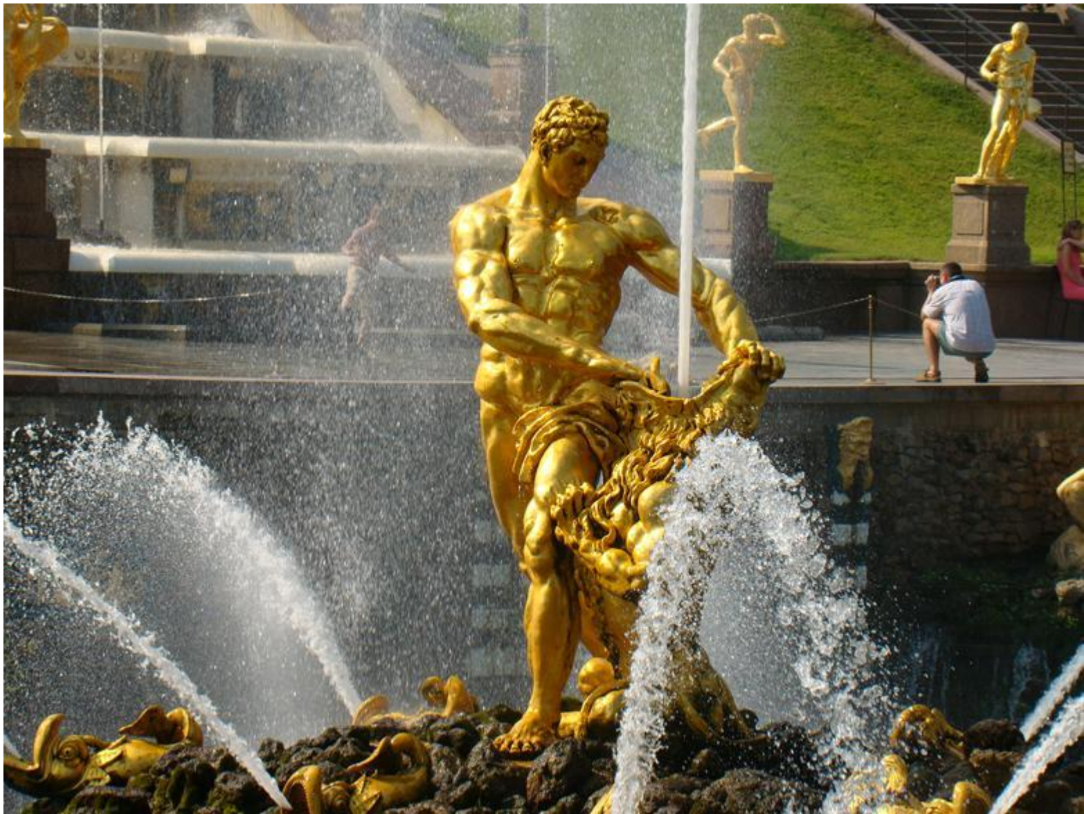
М.И.Козловский. «Самсон, раздирающий пасть льва». 1800–1802 гг. Классицизм.