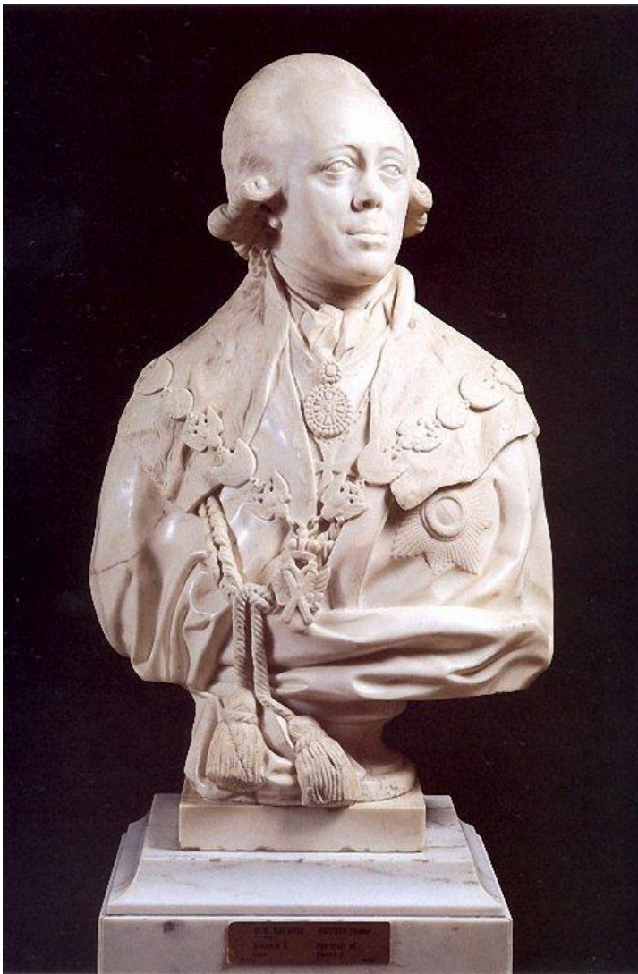
Русский музей Ф.И.Шубин. «Портрет Павла I». 1797 г. Классицизм+реализм. (Какой из...? Я не поняла)