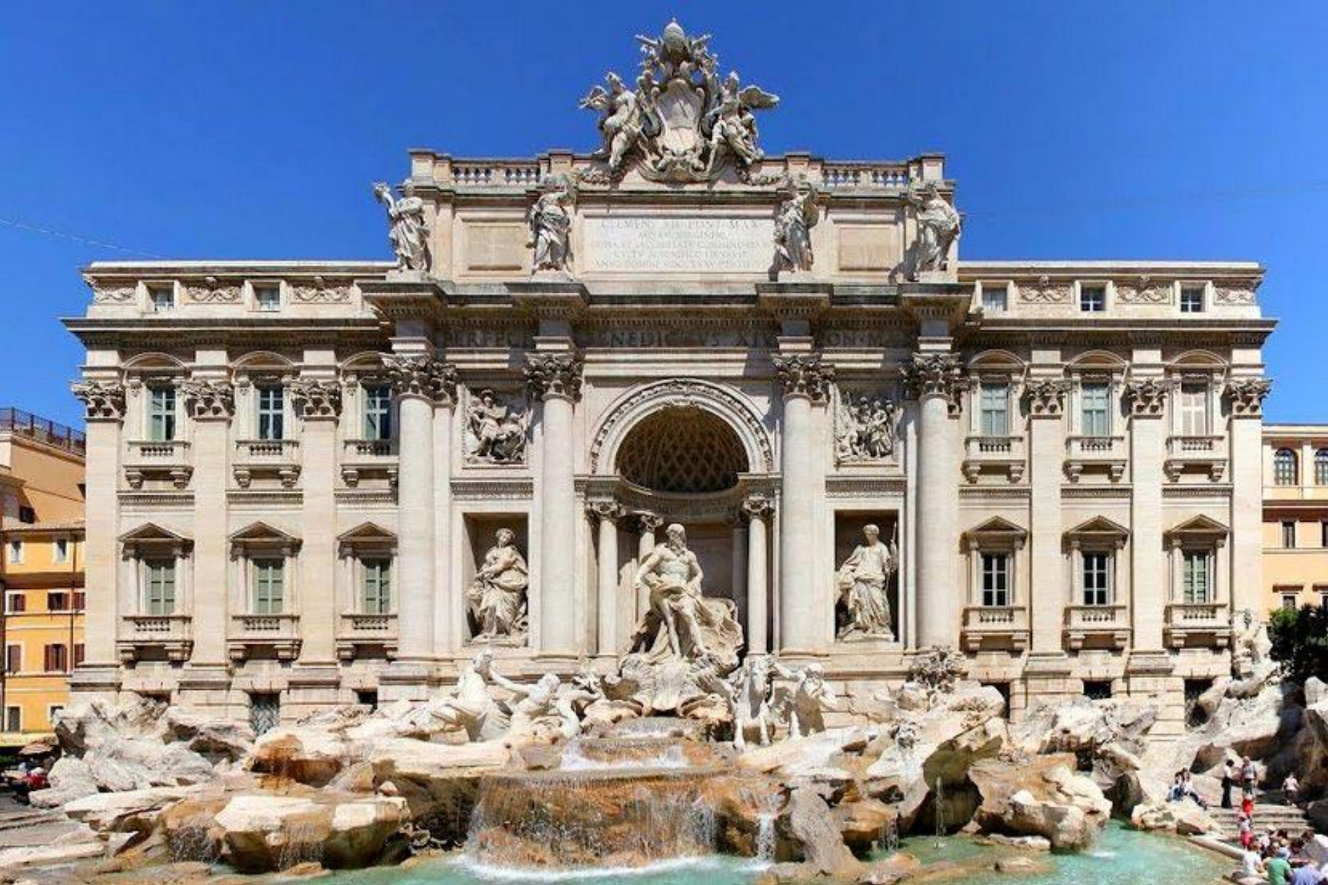
Никколо Сальви (проект). Фонтан Треви в Риме. 1732-1762 г. Позднее барокко.