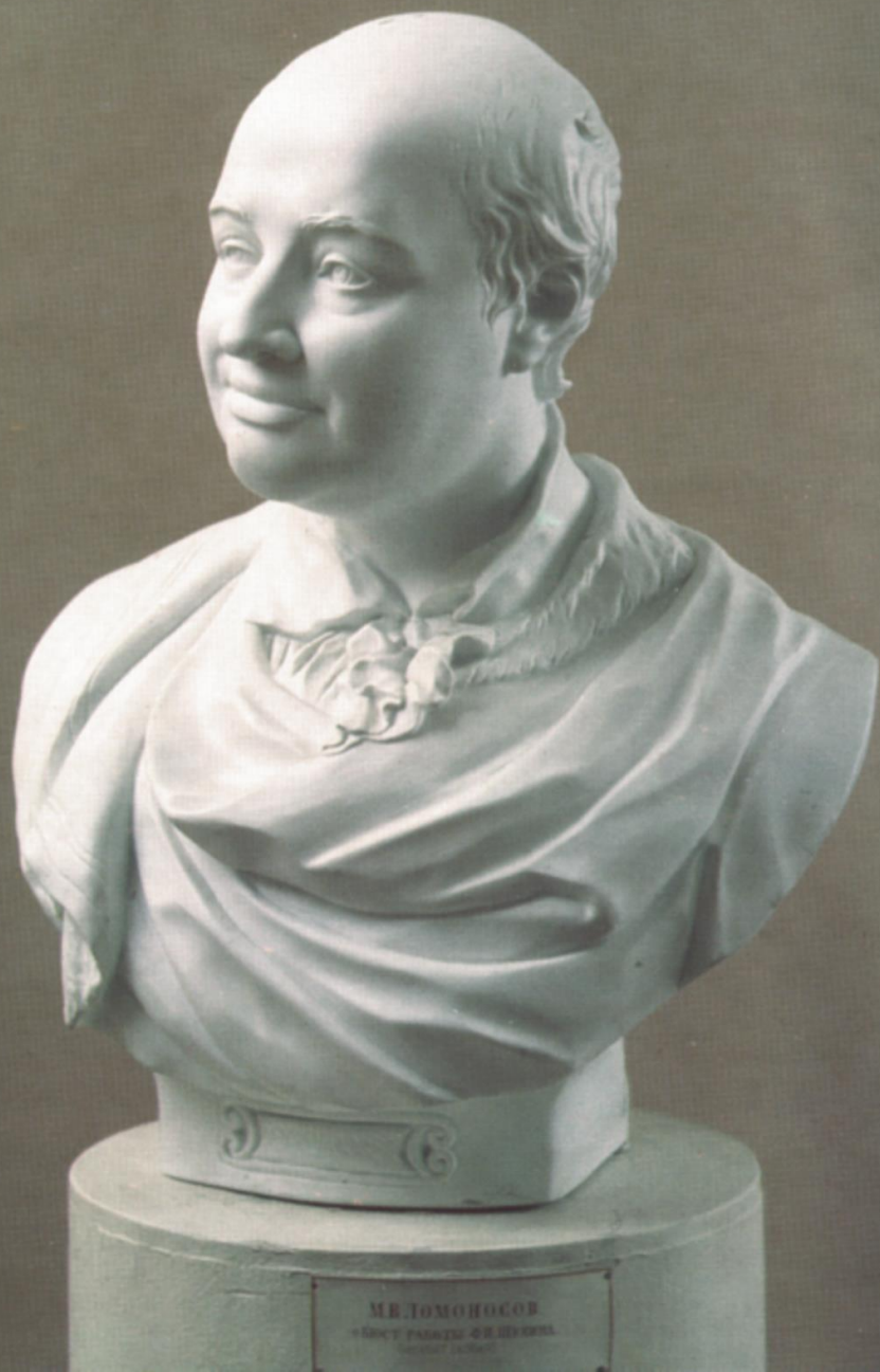
Ф.И.Шубин. «Портрет М.В. Ломоносова». 1792 г. Классицизм+реализм.