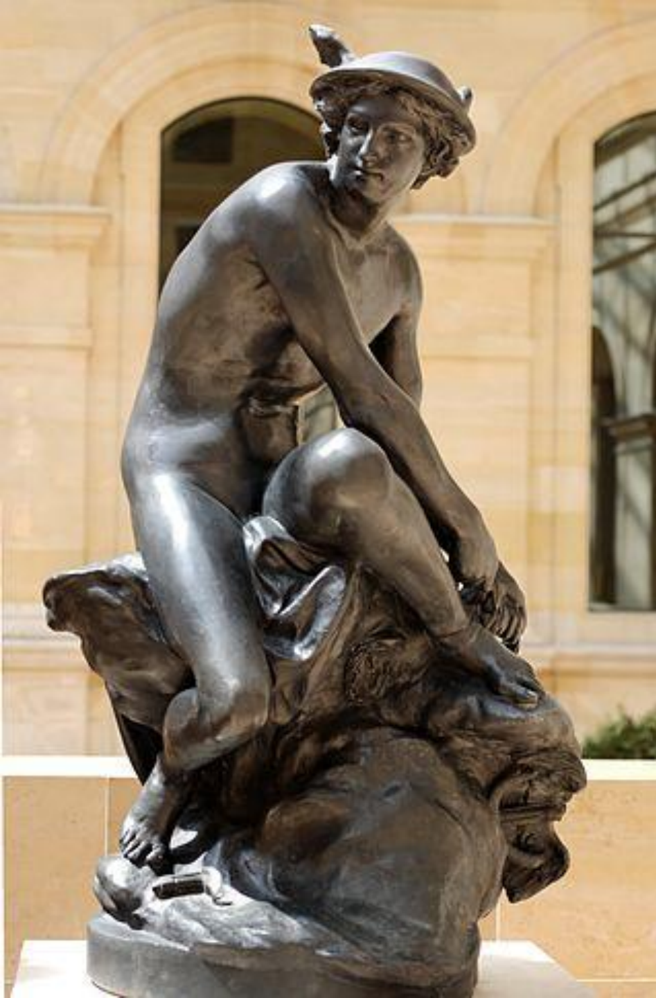
Жан-Батист Пигаль (1714–1785). Меркурий, завязывающий сандалию. 1744. Классицизм.