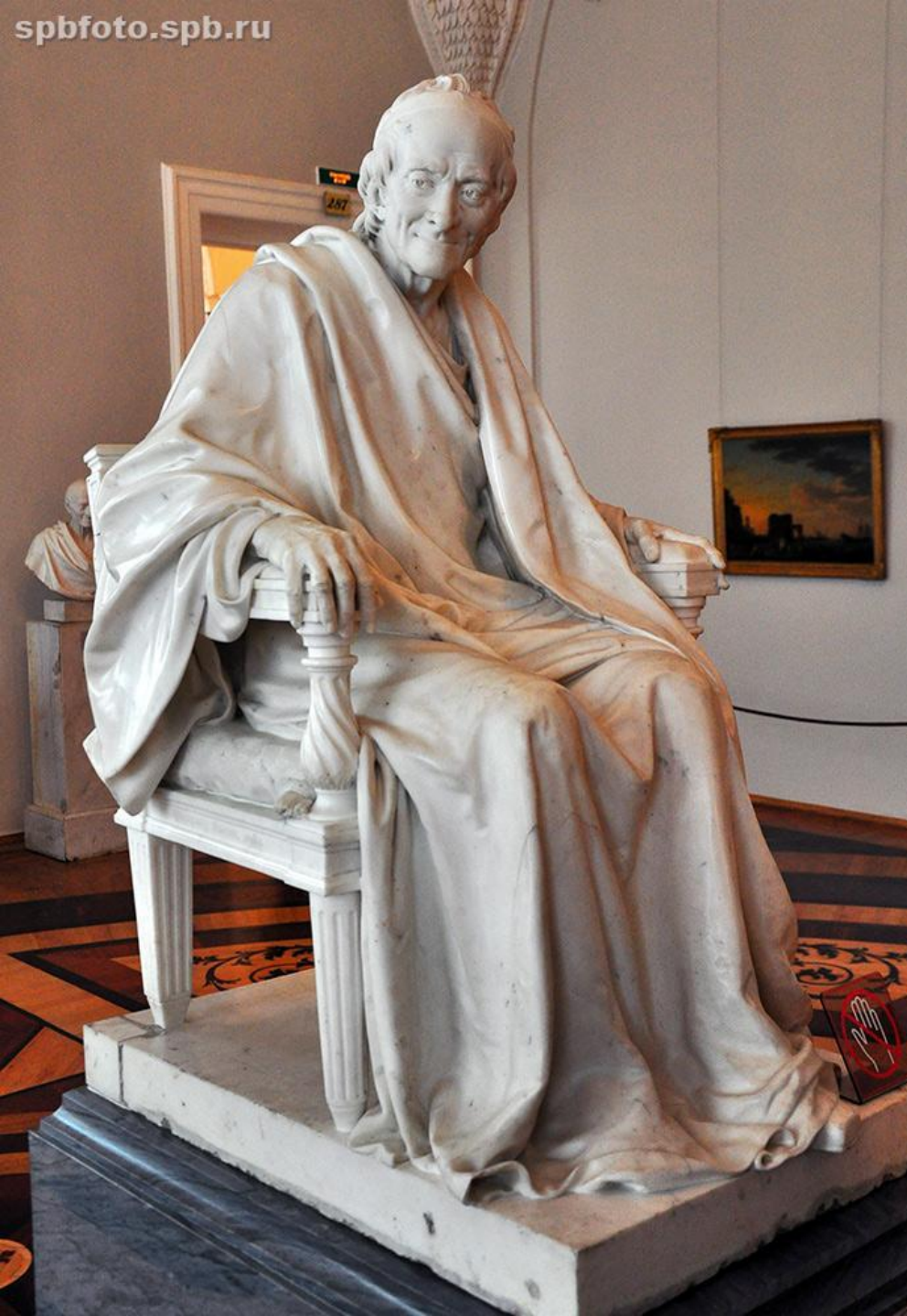
Жан Антуан Гудон (1741–1828). «Вольтер, сидящий в кресле». 1781 г. (ГЭ). Классицизм.