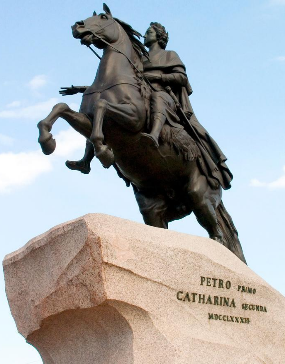
Этьен Морис Фальконе (1716–1791). Памятник Петру I «Медный всадник». 1768–1782 г. Классицизм.