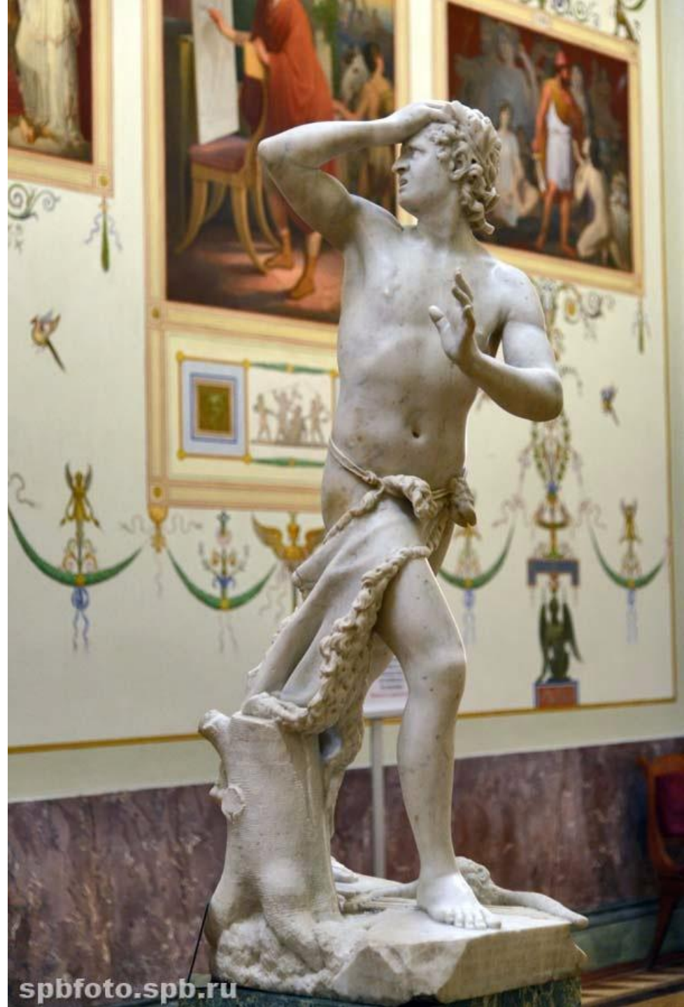
Антонио Канова. «Орфей». (ГЭ). Позднее барокко.