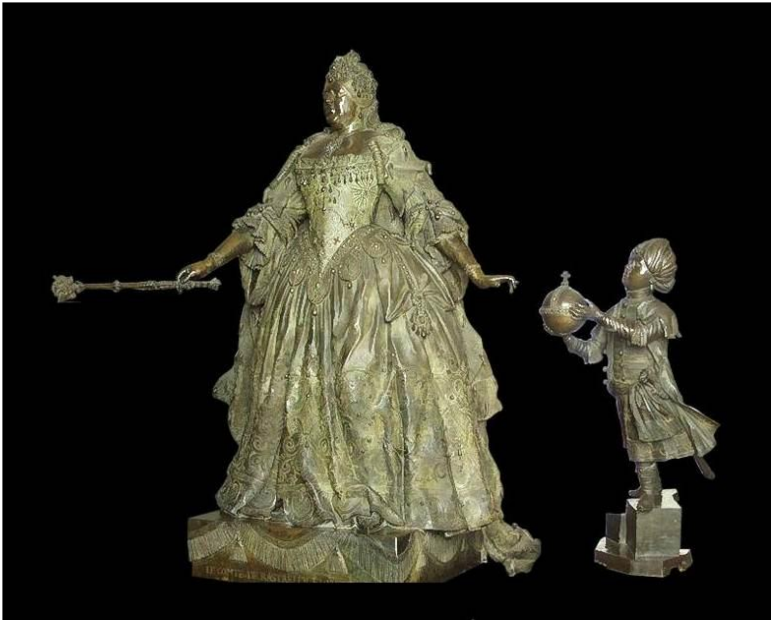
Карло Бартоломео Растрелли. «Анна Иоанновна с арапчонком». Барокко.