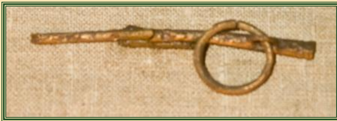
Булавка с кольцом, бронза. (VIII-IX век).