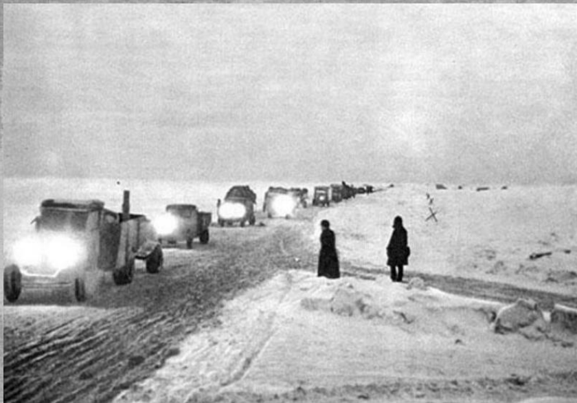
Ленинград, 1941 год. Начало прокладки "Дороги жизни"

Чтобы как-то помочь осажденным жителям, через Ладогу была организована "Дорога жизни", единственная военно-стратегическая транспортная магистраль, связывающая в сентябре 1941 - марте 1943 года осажденный немецко-фашистскими войсками Ленинград со страной