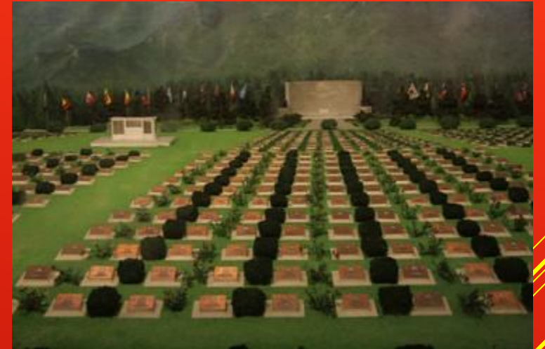
Мемориал павшим в Корейской войне

Общие потери ВВС сторон составили более трех тысяч летательных аппаратов сил ООН и около 900 самолетов ВВС КНР, КНДР и СССР.