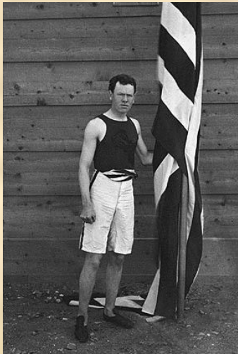
Легкоатлет зі США Джеймс Конноллі – перший олімпійський чемпіон сучасності, 1896, переміг у потрійному стрибку