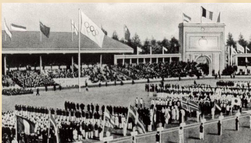
Вперше в історії олімпійського спорту на церемонії відкриття Ігор VII Олімпіади над стадіоном було піднято олімпійський прапор з п'ятьма кільцями