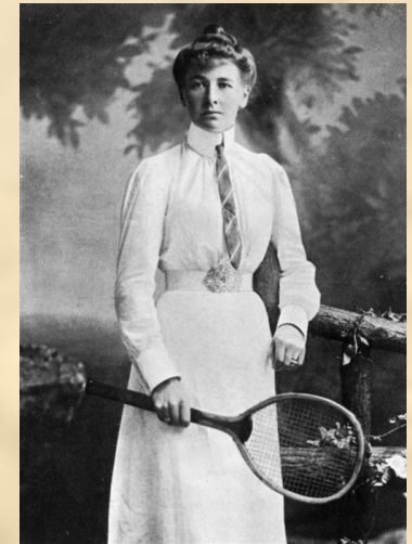
Тенісистка з Англії Шарлотта Купер – перша олімпійська чемпіонка сучасності, 1900