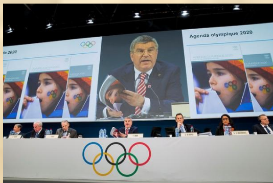
2014 р. відбулось прийняття стратегії розвитку олімпійського руху