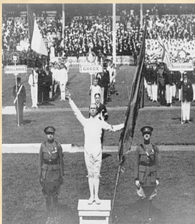
На церемонії відкриття Ігор VII Олімпіади в Антверпені (1920) олімпійську клятву вперше виголосив бельгійський фехтувальник Віктор Буан