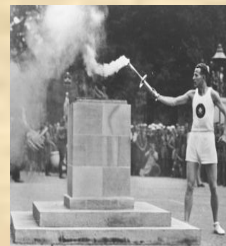
Німецький спортсмен Фріц Шільген запалює олімпійський вогонь