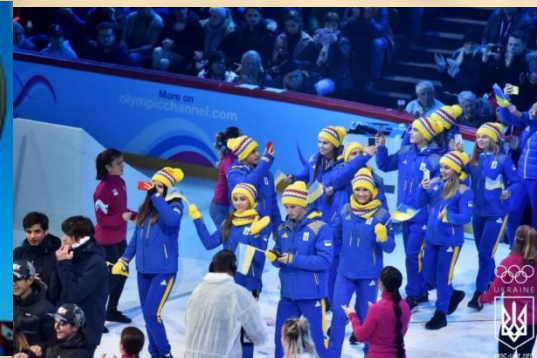
Збірна команда України на зимових юнацьких Олімпійських іграх 2020 р.