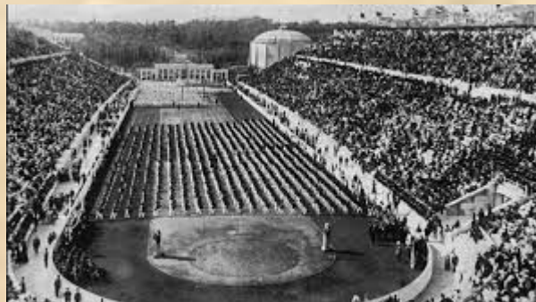
Перші Олімпійські ігри сучасності відбулись в Афінах 6-16 квітня 1896 р.