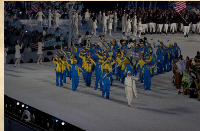
Дебют збірної команди України на Олімпійських іграх 1994 р.