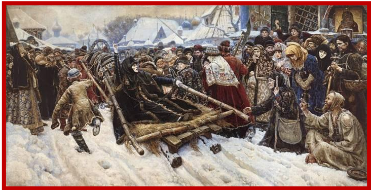
Суриков В.И. Боярыня Морозова.