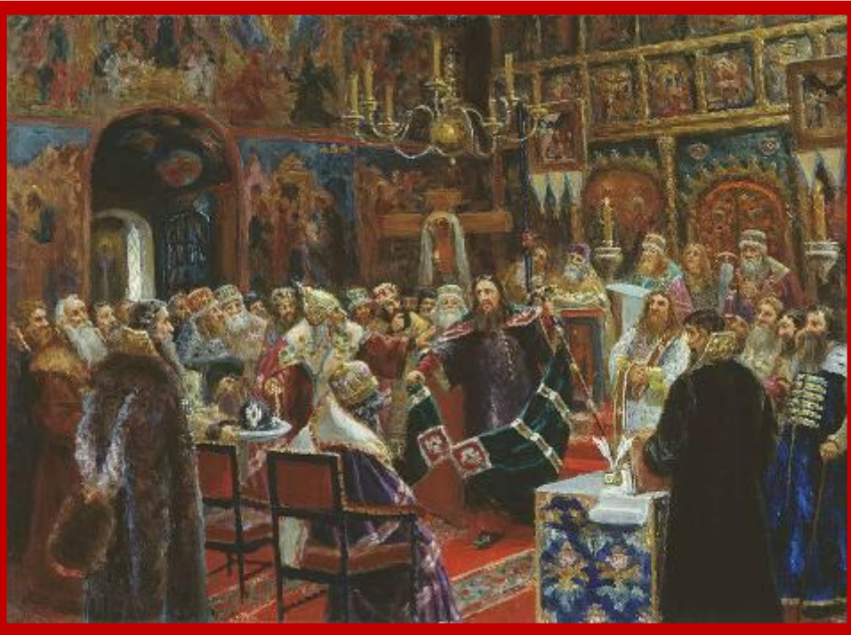
Суд над патриархом Никоном (С. Д. Милорадович, 1885 год)