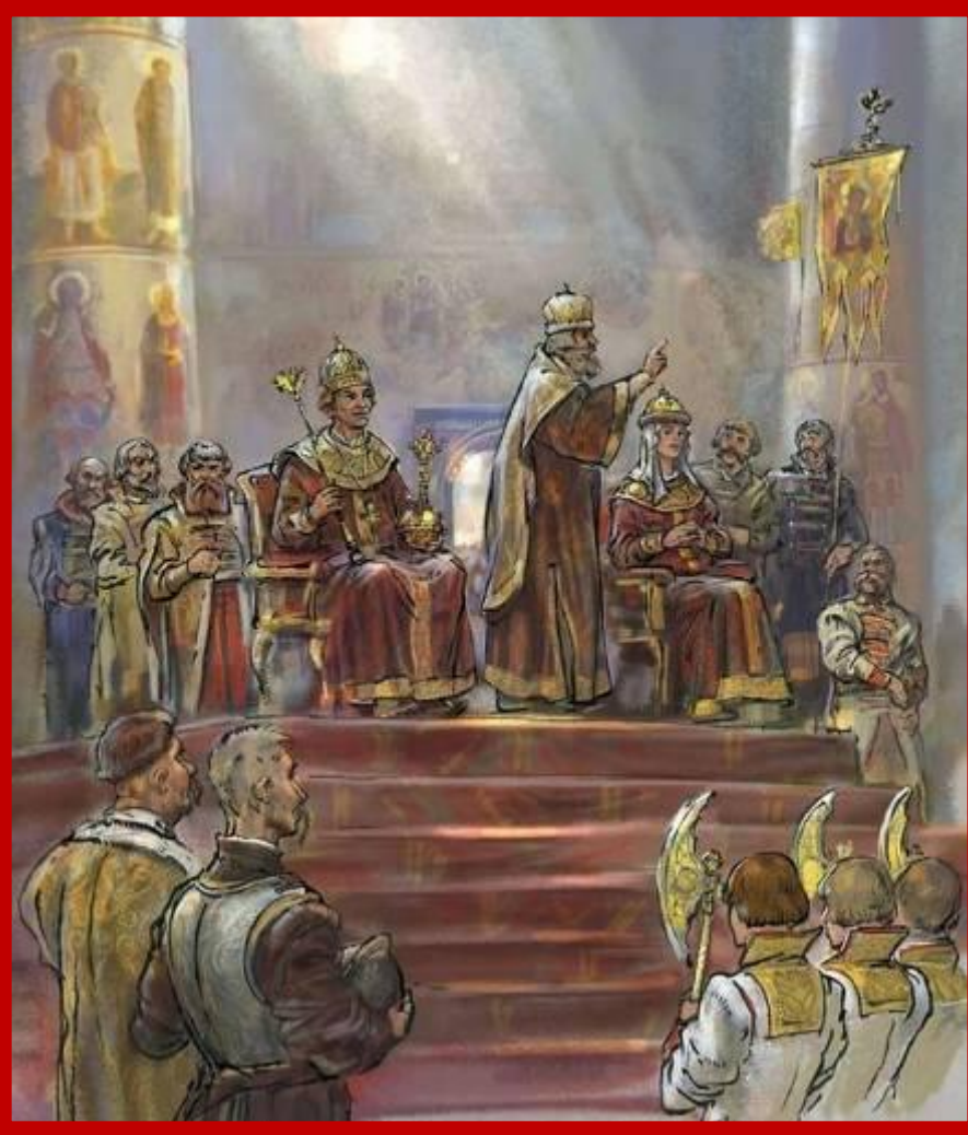
Венчание на царство Марины Мнишек