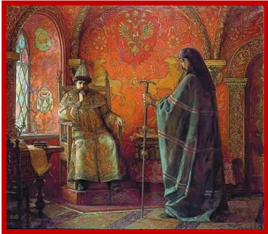
"Царь Алексей Михайлович и Патриарх Никон"

1658 год – Никон удалился в Воскресенский Новоиерусалимский монастырь