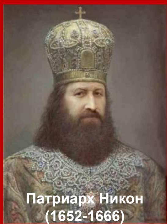
Патриарх Никон (1652-1666)

1652 г. – избрание Никона новым патрирхом России