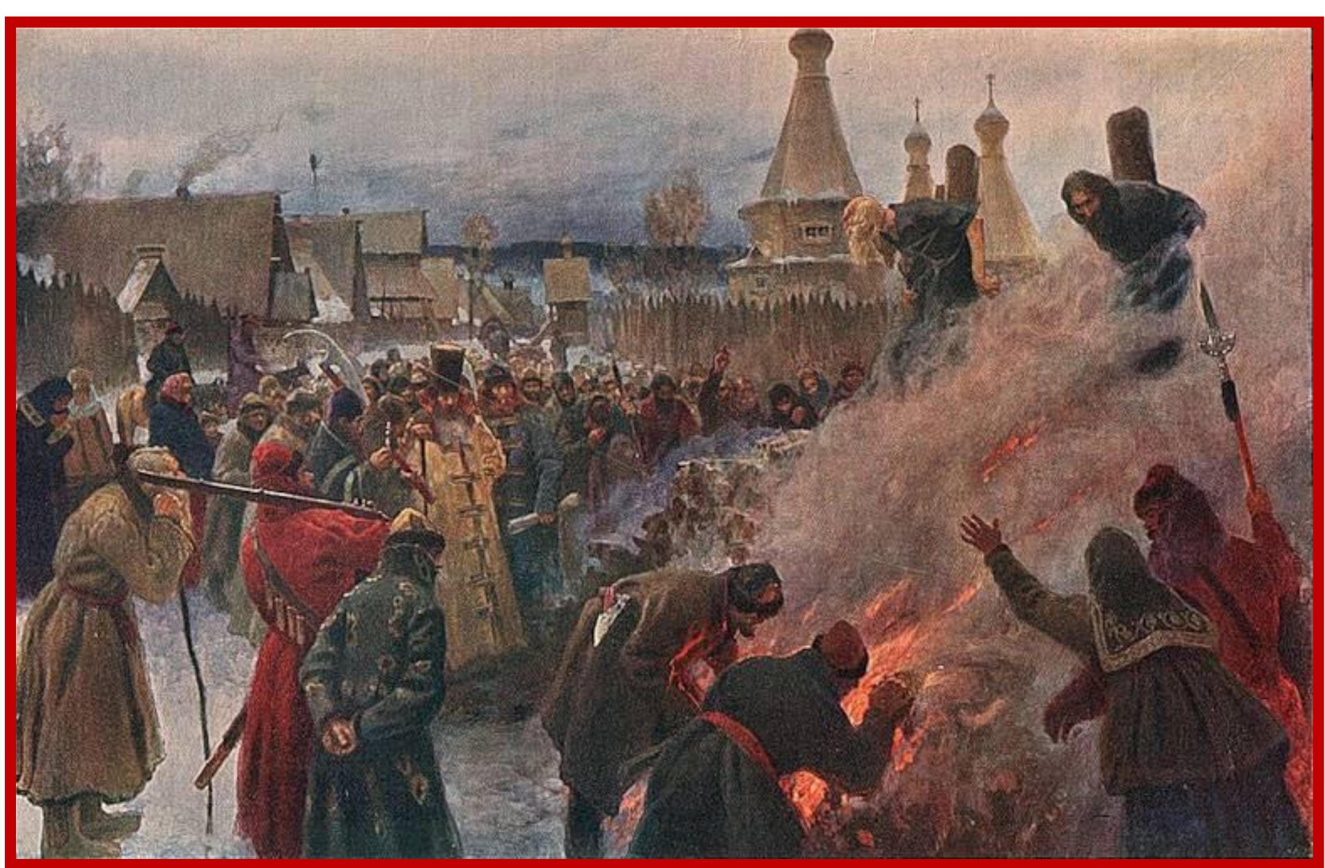
Григорий Мясоедов. "Сожжение протопопа Аввакума".