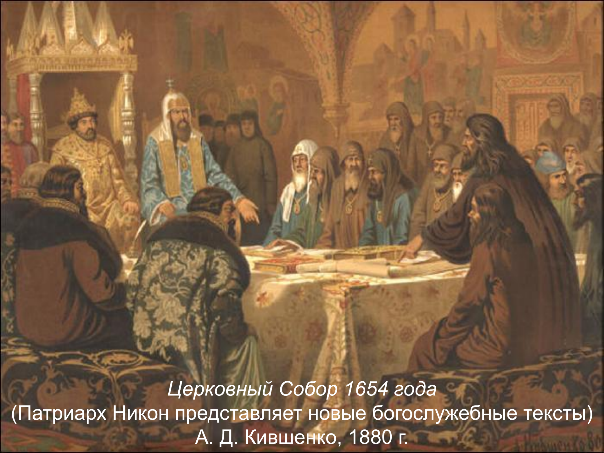
Церковный Собор 1654 года (Патриарх Никон представляет новые богослужебные тексты) А. Д. Кившенко, 1880 г.