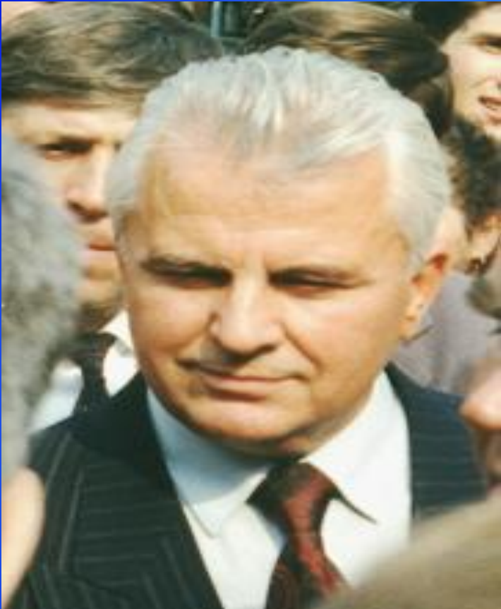
Леонид Макарович Кравчук. В 1991—1994г.г. — первый Президент Украины .