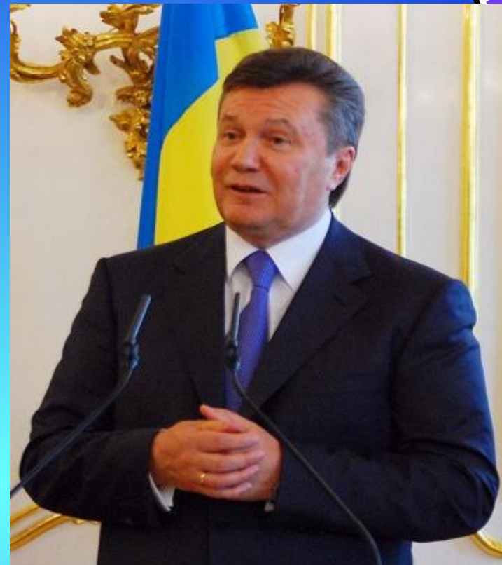
Виктор Фёдорович Янукович. Четвёртый Президент Украины с 25 февраля 2010 года.