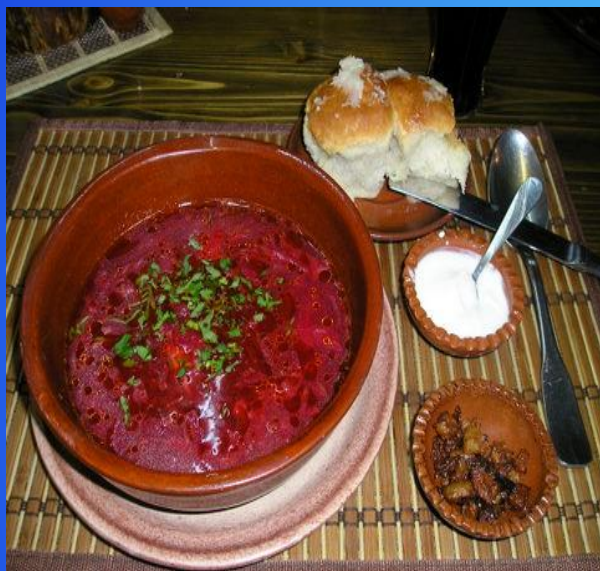
Борщ с пампушками.