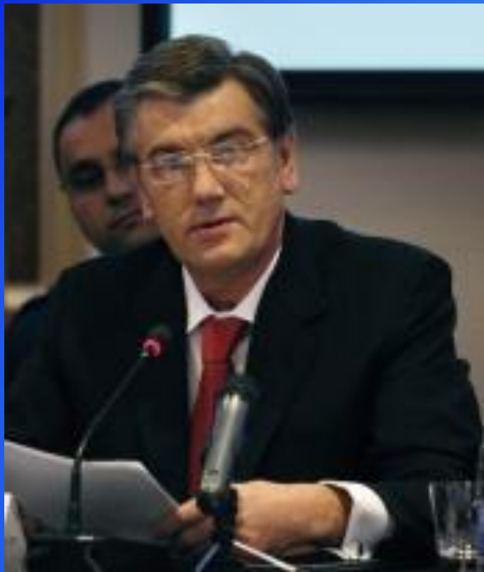
Виктор Андреевич Ющенко. Третий Президент Украины с 2005 по 2010 год.