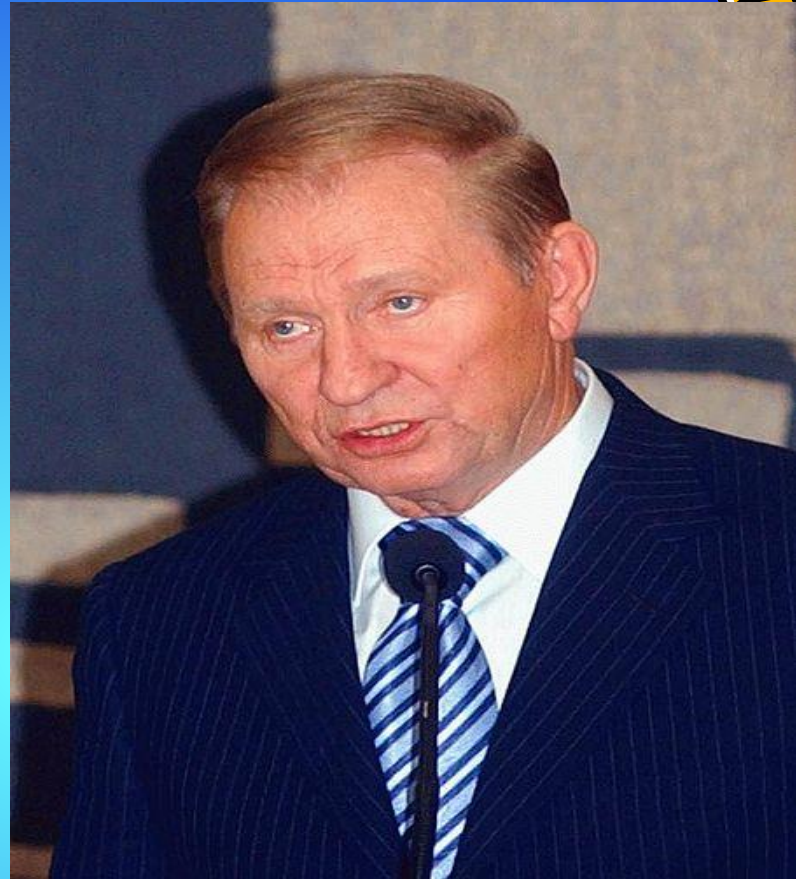
Леонид Данилович Кучма. В 1994—2005 — второй Президент Украины.