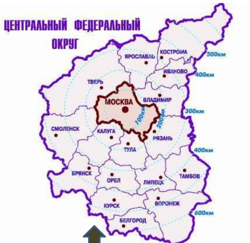
Центральный и Центрально-Черноземный районы