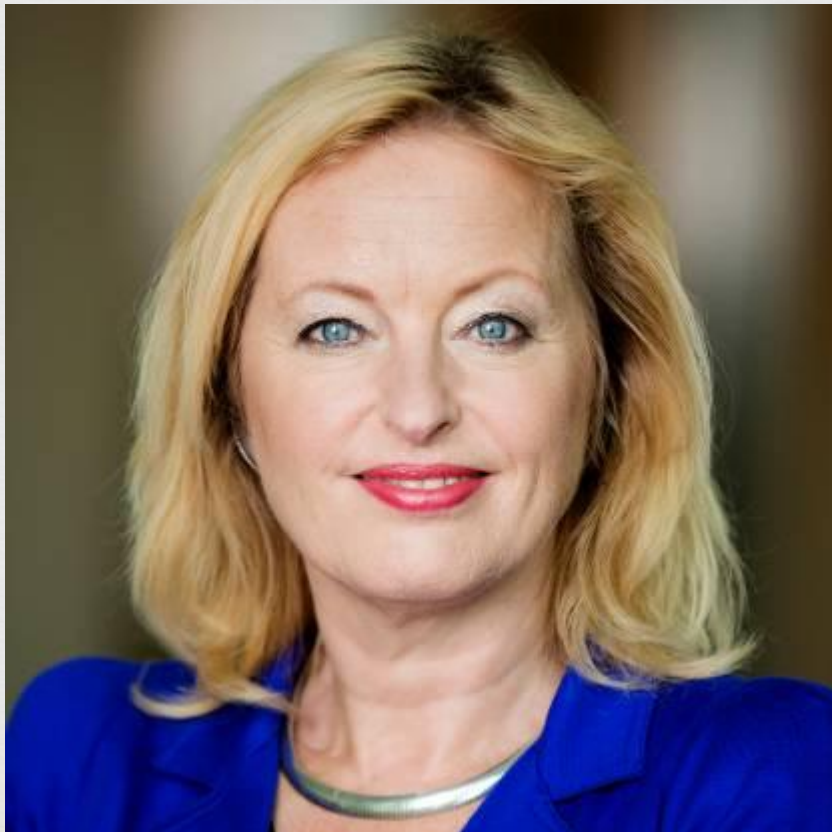
Министр культуры- Jet Bussemaker