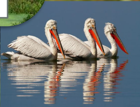
Природный образ Кеоладео