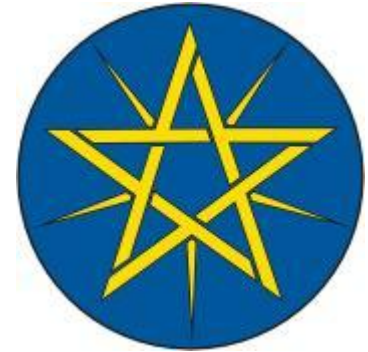
Государственная эмблема Эфиопии (1996 г.)