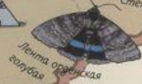
Лентя орденская голубая