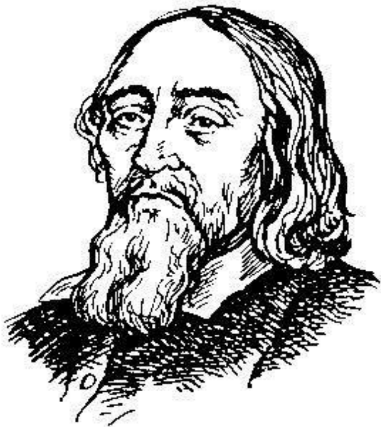
Ян Амос Каменский (1592-1670) Пансофизм