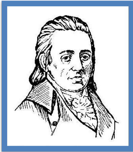
Иоганн Генрих Песталоцци (1746-1827) швейцарский педагог, основоположник дидактики начального обучения.