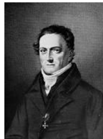
ИОГАНН ФРИДРИХ ГЕРБАРТ (1776-1841), немецкий философ, психолог и педагог