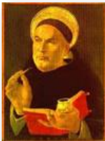
ФОМА АКВИНСКИЙ (1225-1247), член монашеского ордена доминиканцев, один из крупных представителей главного направления в философии средневековья – схоластики