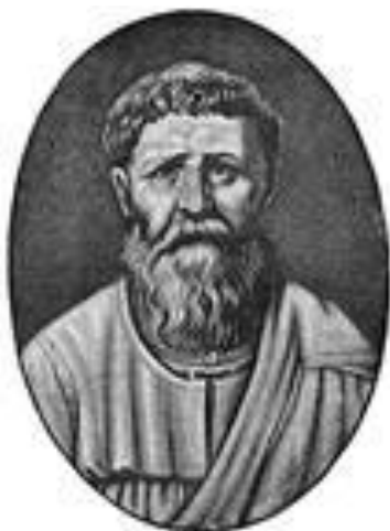
АВРЕЛИЙ АВГУСТИН (354-430), епископ, прозванный богословами блаженным

Авторитарная педагогика утверждает идею подчинения воспитанника воле педагога