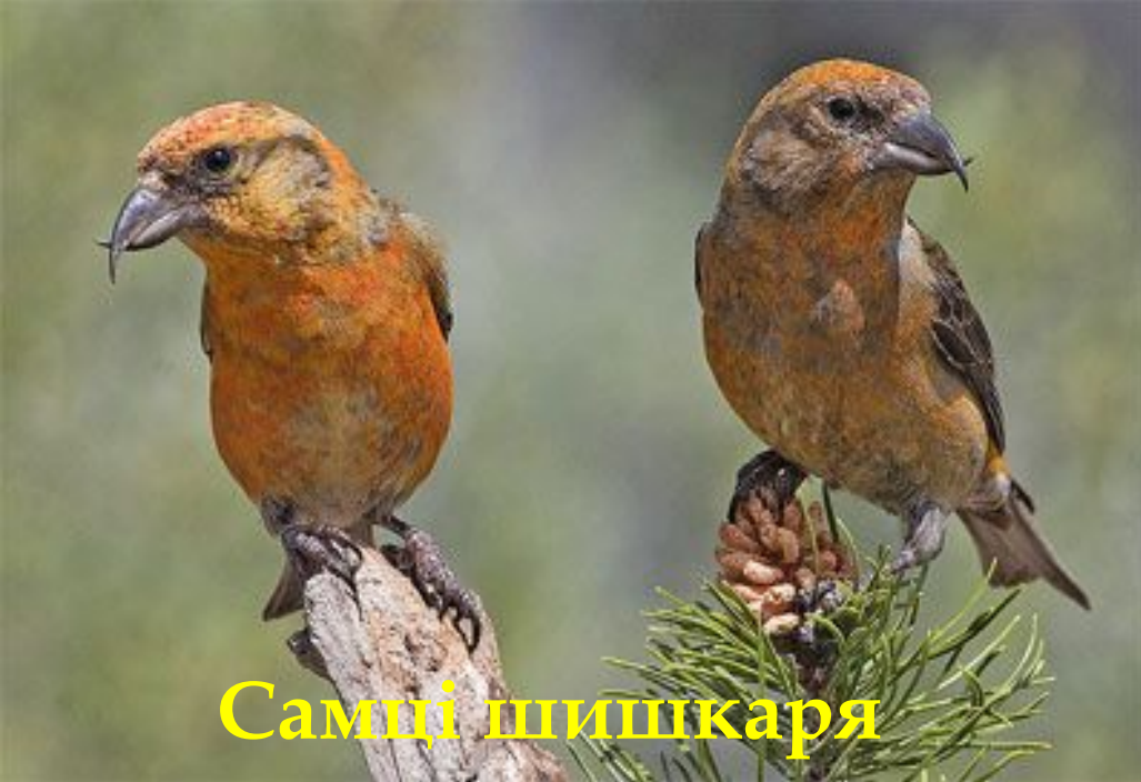
Самці шишкаря ЯЛИНОВОГО