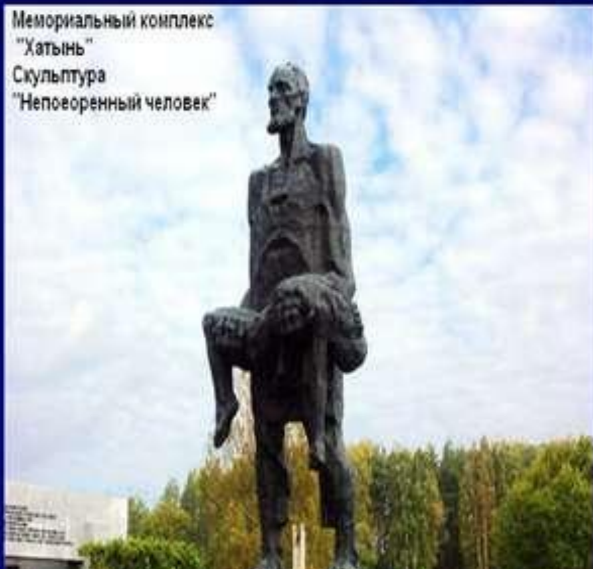
Мемориальный комплекс "Хатынь" Скульптура "Непокоренный человек"

Хатынь - одна из 186 деревень, полностью сожжённых фашистами во время войны. Хатынь стала символом массового уничтожения мирного населения, осуществлявшегося нацистами и коллаборационистами на оккупированной территории СССР.