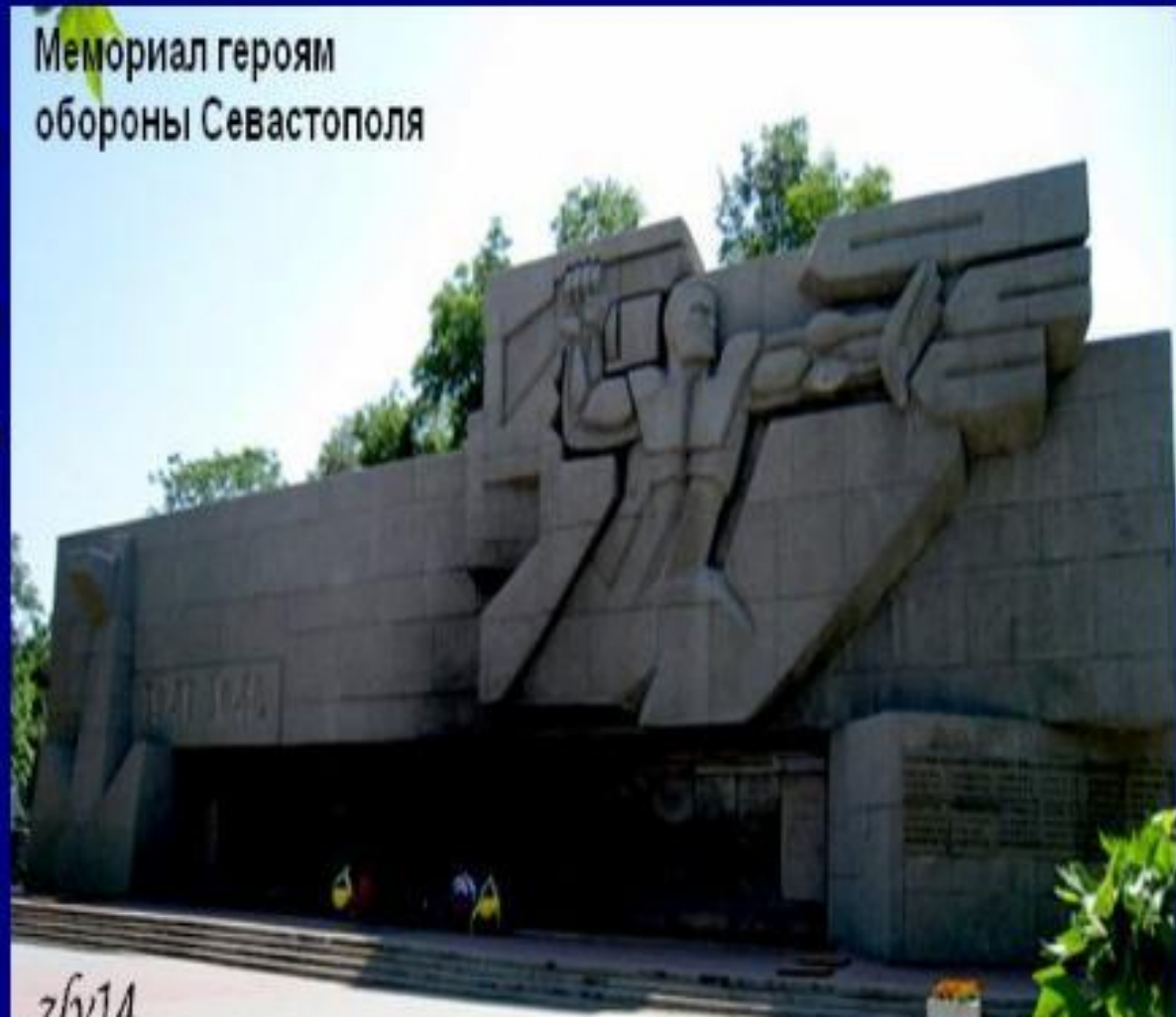
Мемориал героям обороны Севастополя

Мемориал воздвигнут на главной площади города - площади Нахимова. Этот монументальный памятник посвящен подвигу Севастополя в годы Великой Отечественной войны.