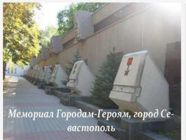
Мемориал Городам-Героям, город Севастополь