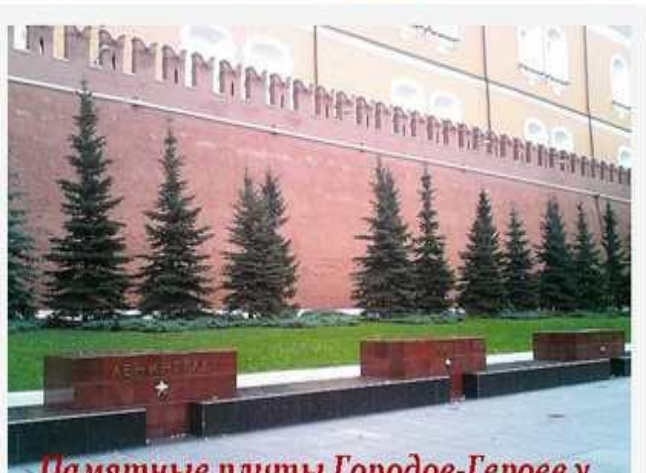
Памятные плиты Городам-Героям