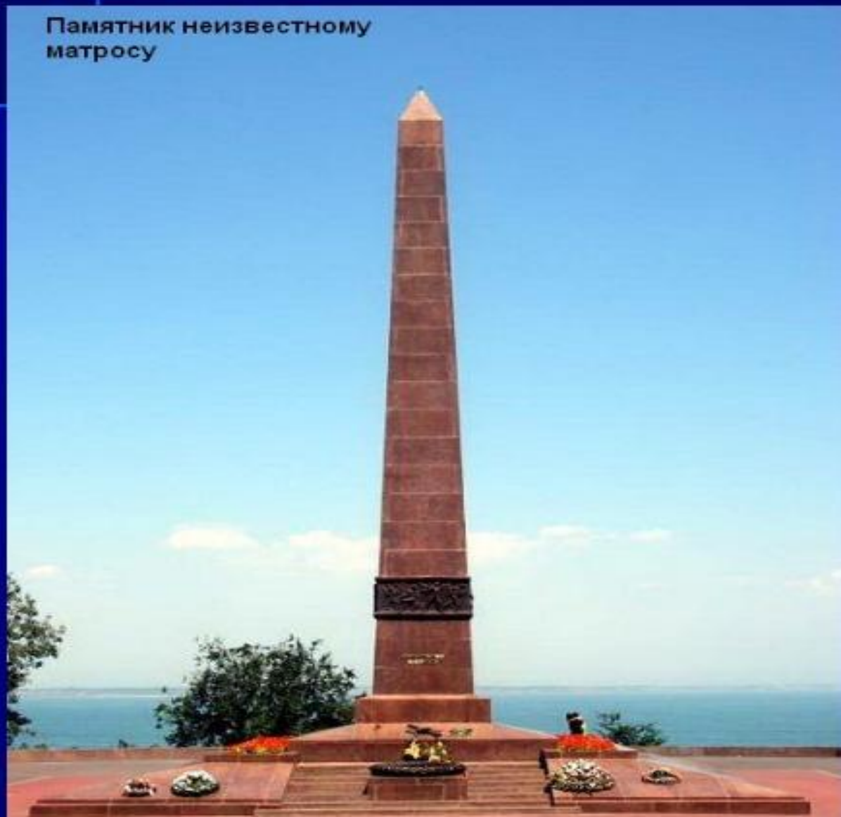
Памятник неизвестному матросу

Одним из четырех городов, впервые названными в статусе городов - героев, была Одесса. Защитники так и не были побеждены. В строжайшей секретности из города были вывезены все войска, часть населения и боевой техники. Оставшиеся жители ушли в катакомбы и продолжали сопротивление.