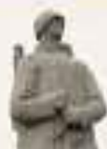
Мемориал «Защитники Советского Заполярья» в городе Мурманск (скульптор-монументалист: С.Д.Борисов)

Памятный знак - память о мурманчанах, ушедших на фронт добровольцами, бойцах и командирах народного ополчения. Именно из них была сформирована особая Полярная дивизия, которая храбро сражалась за каждый клочок родной земли.