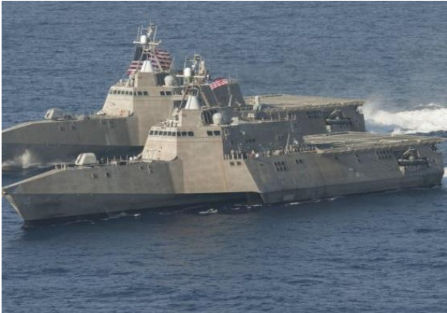
Корабли типа LCS-2 («боевые корабли прибрежной зоны»), США