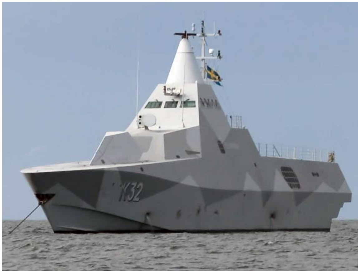
Корвет типа «Висбю» (Швеция), построенный по технологии «стелс»