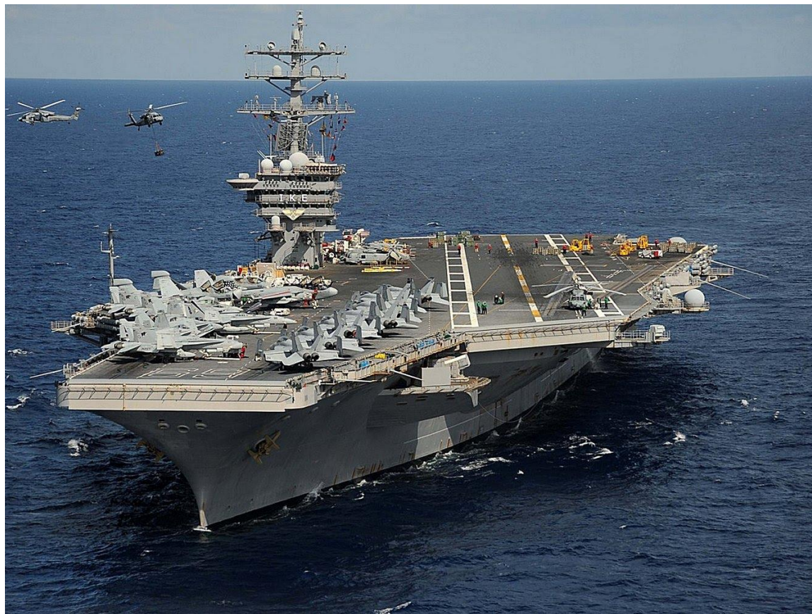
Авианосец типа «Честер Нимитц» (США)