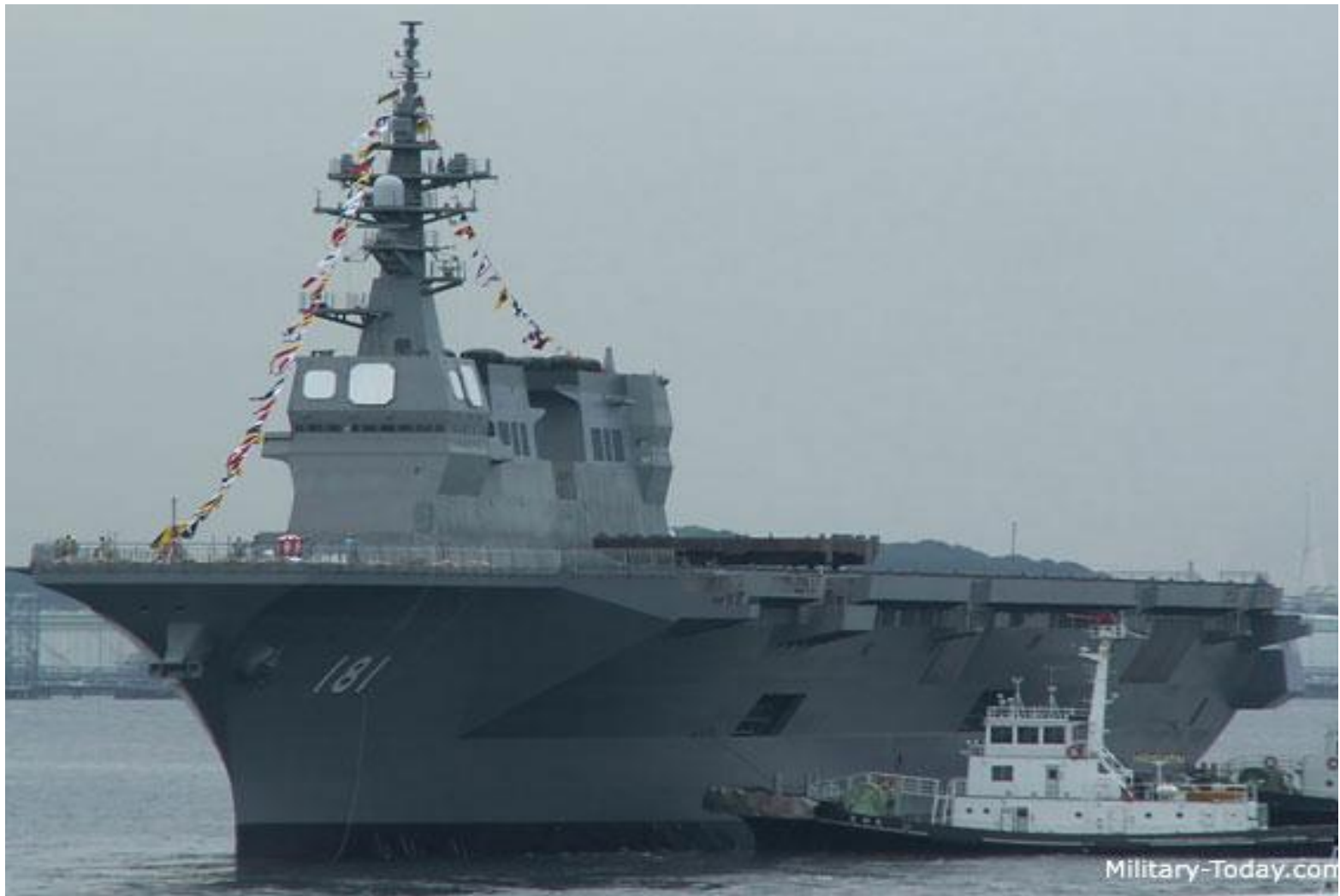
Эсминец-вертолетоносец класса «Хиуга» (Япония)