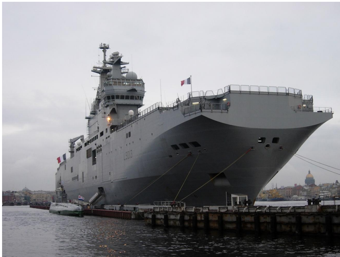
Универсальный десантный корабль- вертолетоносец «Мистраль» (Франция)