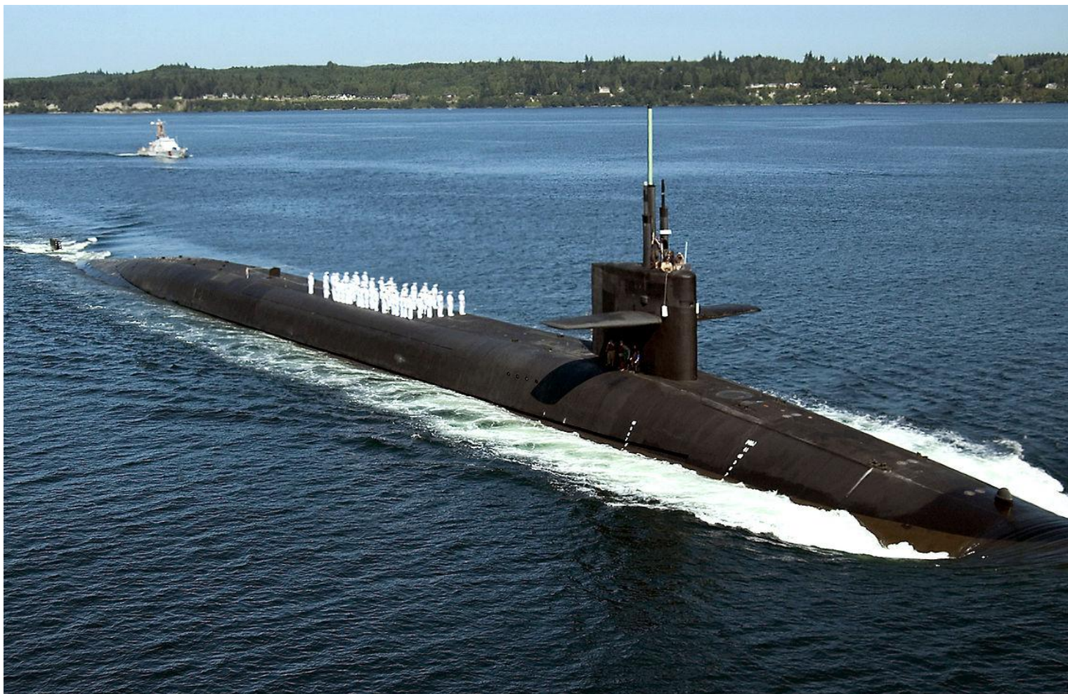
ПЛАРБ типа «Огайо» (США)