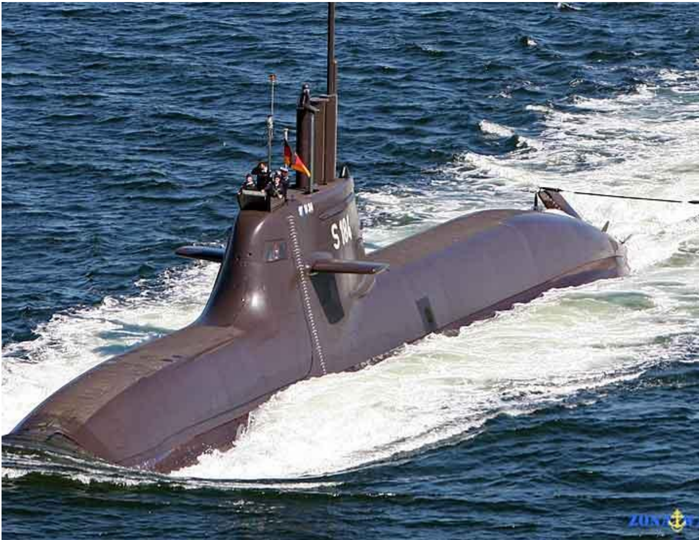
ДЭПЛ проекта 212А (Германия)