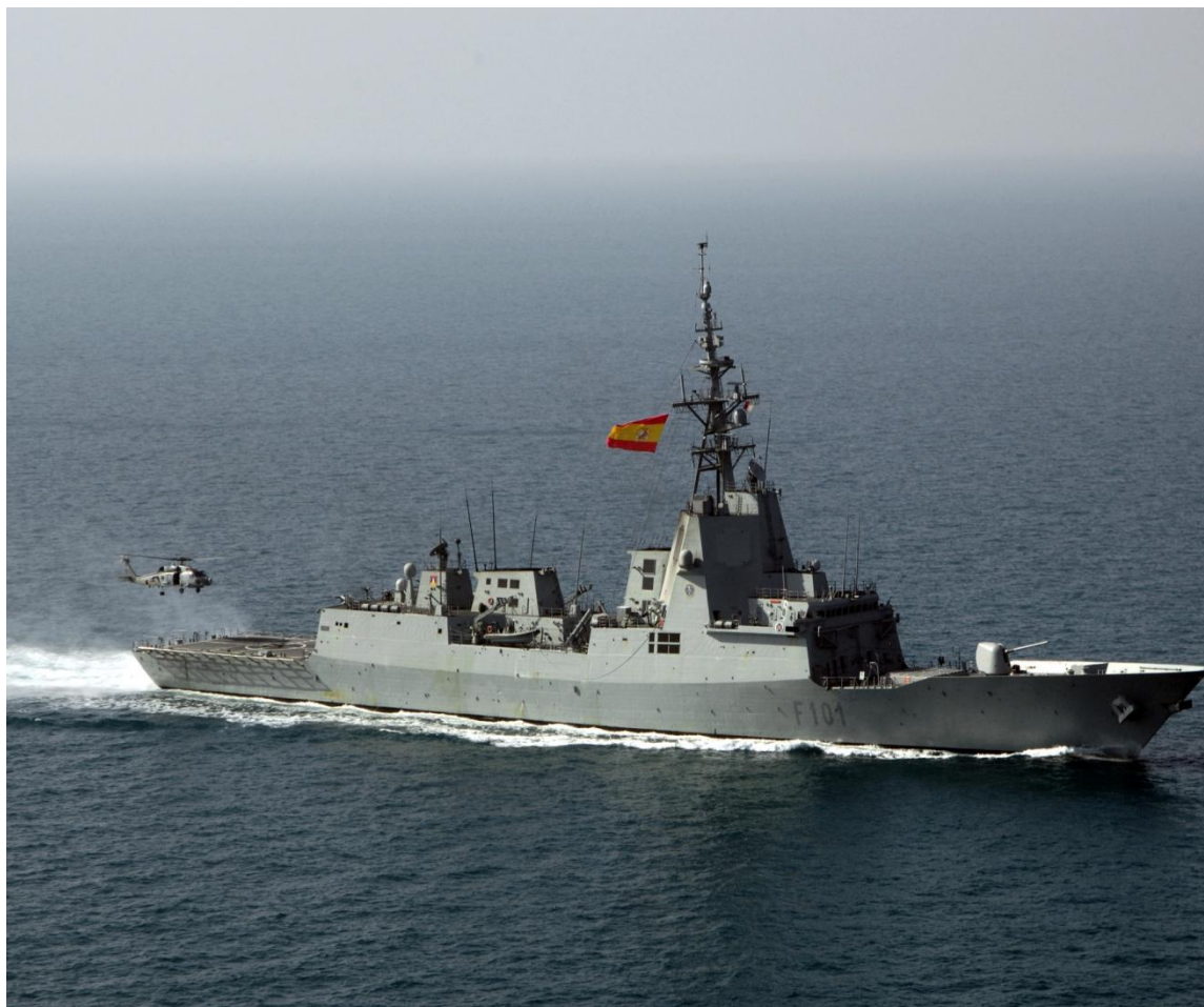
Фрегат типа «Альваро де Базан» (Испания)