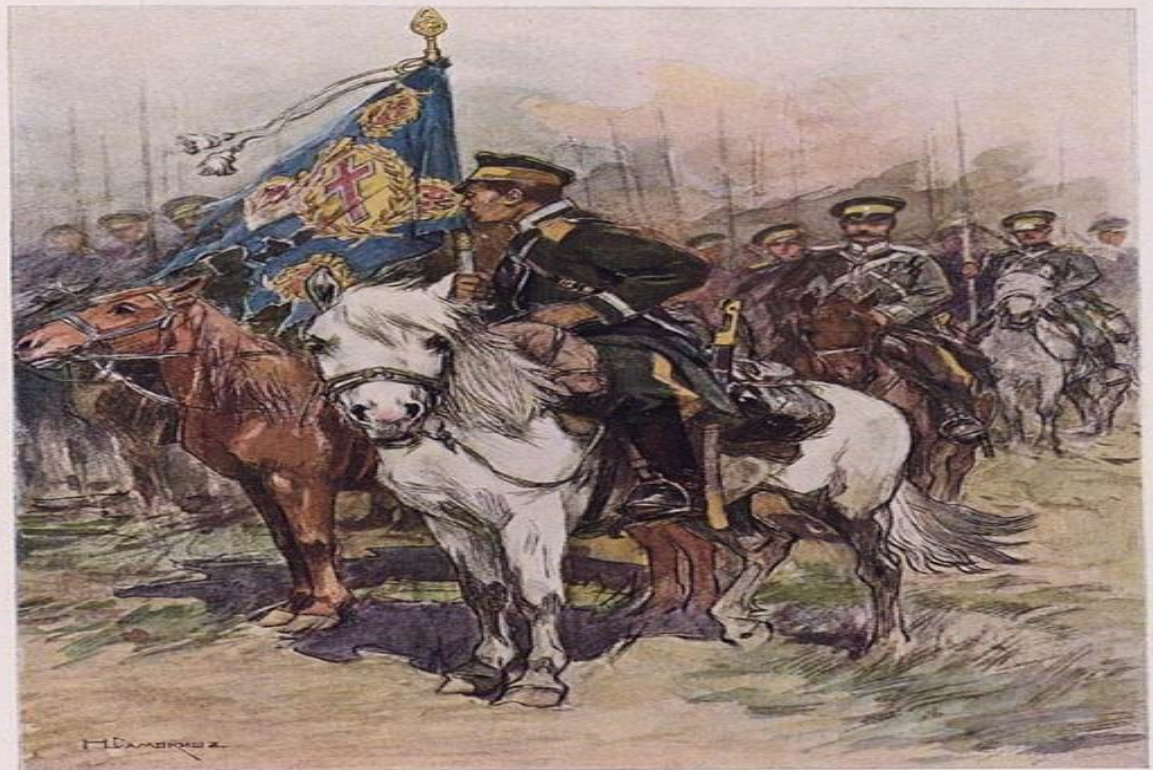
Знамя 1-го Нерчинского полка Заб. http://www.liveinternet.ru/users/illabes/

«... А при батальоне было знамя, И молил поручик в грозный час, Чтобы Небо сжалось над нами, Чтобы Бог святыню нашу спас...»