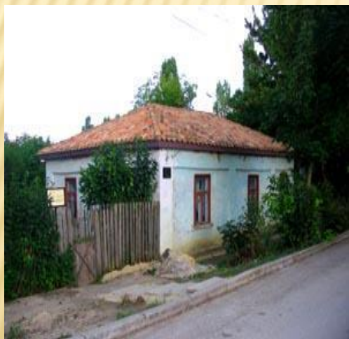
ДОМ-МУЗЕЙ ПАУСТОВСКОГО В ТАРУСЕ"