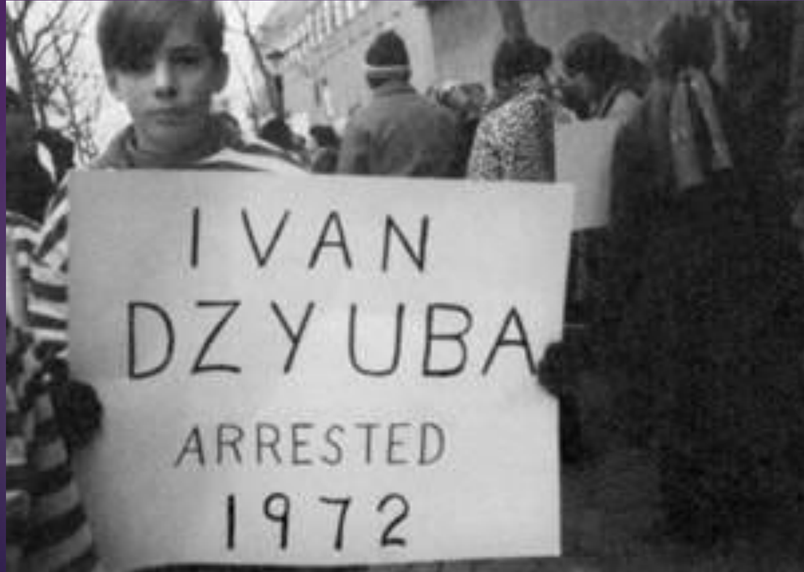
ДЕМОНСТРАЦІЯ ПРОТЕСТУ ПРОТИ ПОЛІТИЧНИХ АРЕШТІВ У СРСР БІЛЯ РАДЯНСЬКОГО ПОСОЛЬСТВА У ВАШИНГТОНІ. 1972 р.