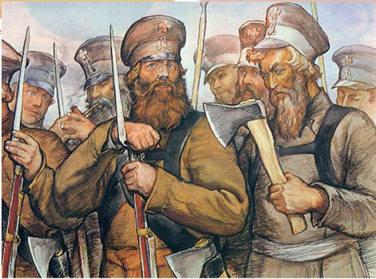
И. Архипов «Ополченцы в 1812 году»

Русский художник И. Архипов показывает, как на защиту своей Родины поднялся весь русский народ, и военные, и простые люди, все, кто умел держать в руках топор или штык.