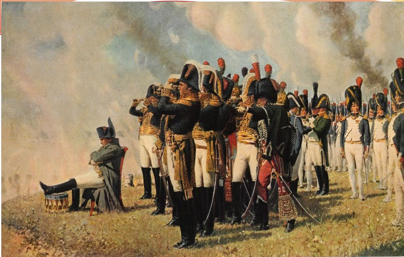
В.В.Верещагин «Наполеон на Бородинских высотах»

На картине изображен Наполеон в своей ставке, за его спиной находятся штабные, свита и гвардия в полной парадной форме.