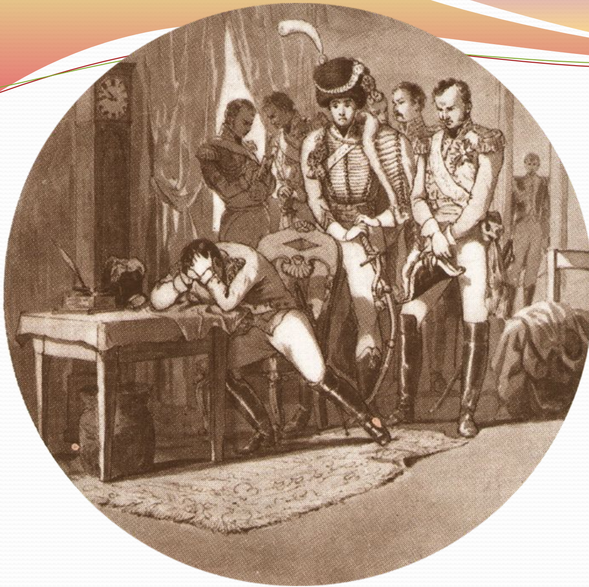
«Наполеон перед выездом из Москвы» И. ИВАНОВ

Рассчитывая на заключение мира, Наполеон провел в Москве слишком много времени. И как опытный полководец понимал, что это чревато утратой инициативы. Кроме этого, надежды на то, что в Москве французская армия отдохнёт и оправится после долгих переходов, казались всё более призрачными, день ото дня она становилась всё менее боеспособной. На картине мы видим Наполеона. Он находится в смятении, в непонятных, смутных чувствах, не знает, что ему делать.