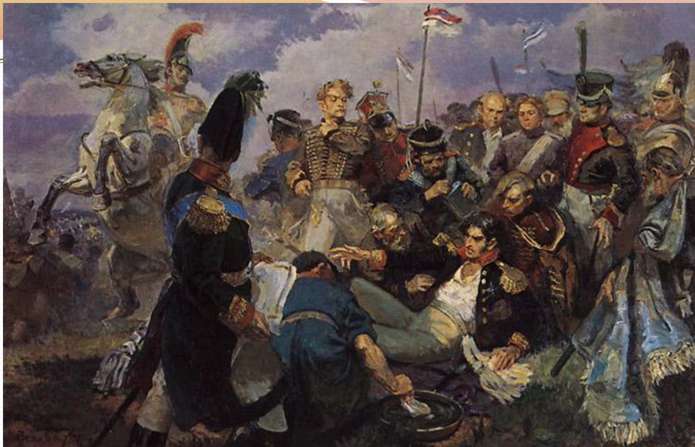
А.Вепхвадзе «Ранение Багратиона на Бородинском поле»

Грузинский художник показывает нам смертельно раненного Багратиона, но уверенного в себе, в победе и по-прежнему, отдающего команды своим воинам, несмотря на боль. Рядом с Багратионом Генерал Коновницын на коне ждет указаний.