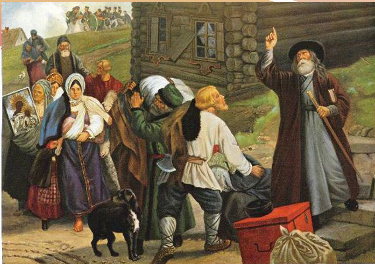
Петер фон Гесс «Бегство населения из Смоленска в день сражения»

На картине «Бегство населения из Смоленска в день сражения» художник старается, как можно более точно показать лица людей, их одежду.