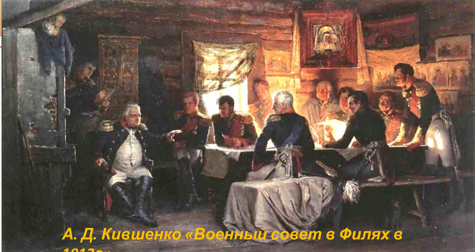
А. Д. Кившенко «Военный совет в Филях в 1812г»

Все персонажи не только портретно похожи — художнику удалось передать их душевное состояние, показать отношение каждого к происходящему. И то сказать: решается судьба России. Оставить Москву или принять сражение? И вот-вот прозвучит знаменитое кутузовское: "С потерей Москвы Россия еще не потеряна".