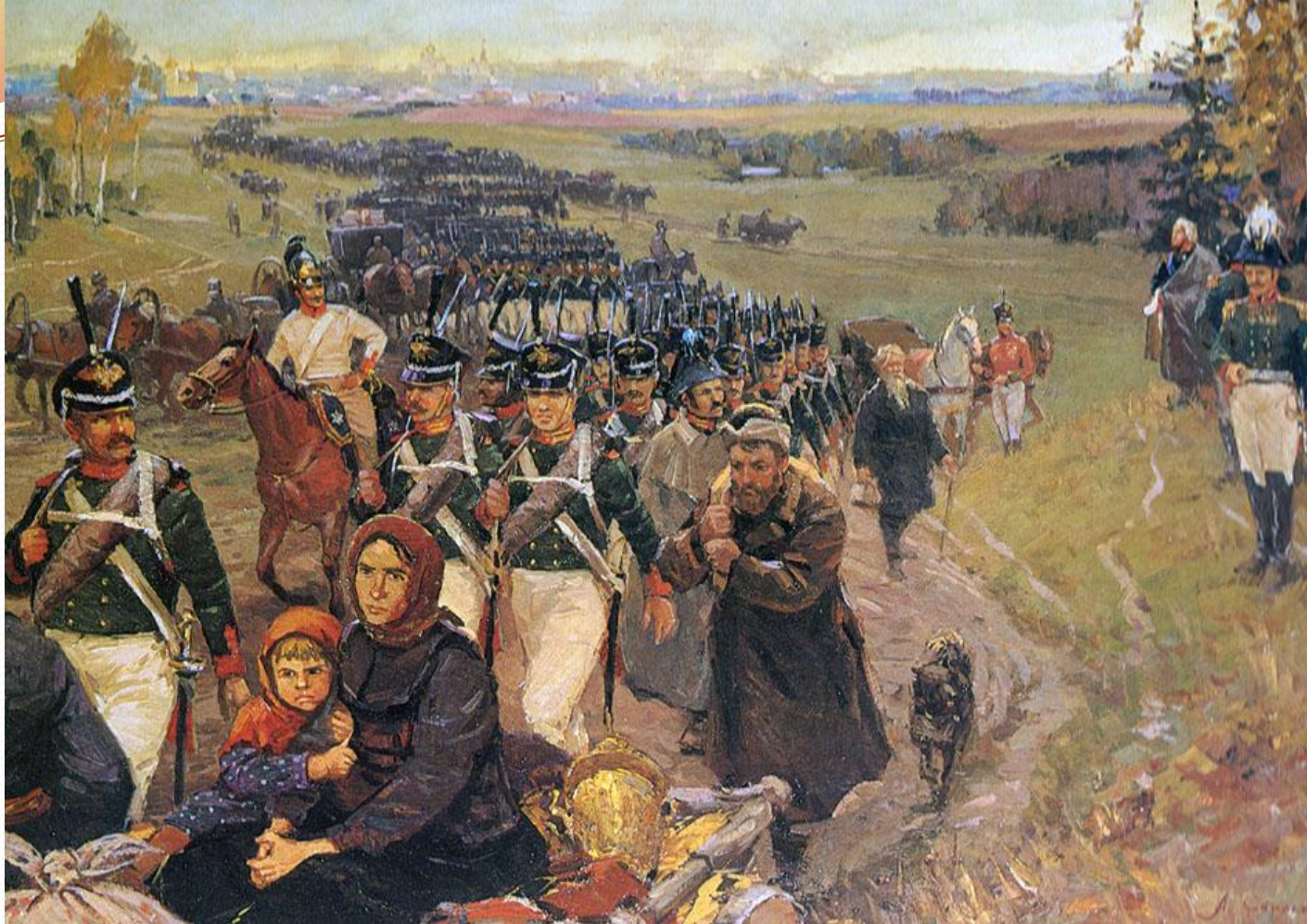
«Русская армия и жители оставляют Москву в 1812 году» А. СЕМЁНОВ А. СОКОЛОВ

Несомненно, никто из жителей Москвы не хотел покидать родной город, насиженные места. Но все же всем пришлось уходить, на картине мы видим и армию, и простой народ (женщина с ребенком на телеге, и старичок, идущий рядом с войском), и даже собачка покидает город. Все люди, изображенные на картине опечалены, их лица выражают грусть.