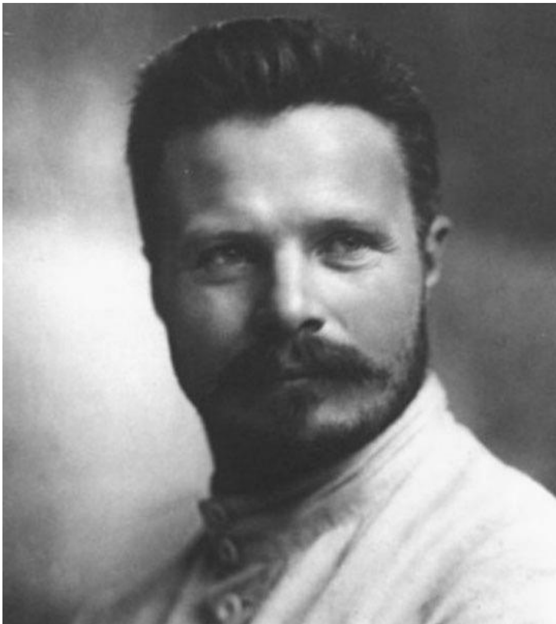
Михаил Васильевич Фрунзе