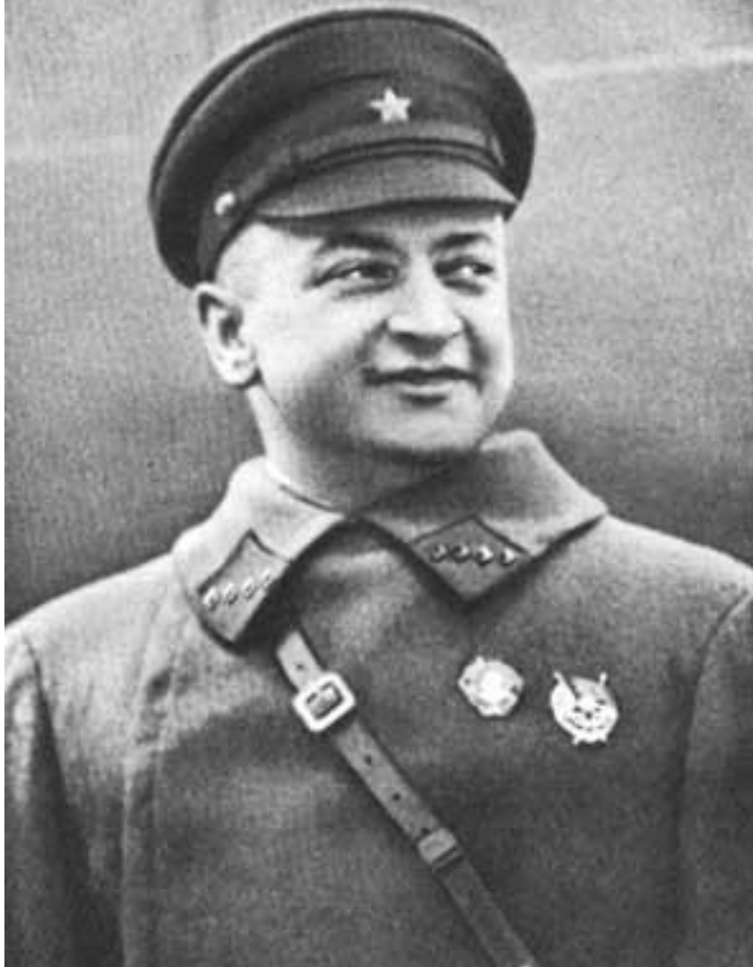
Михаил Николаевич Тухачевский