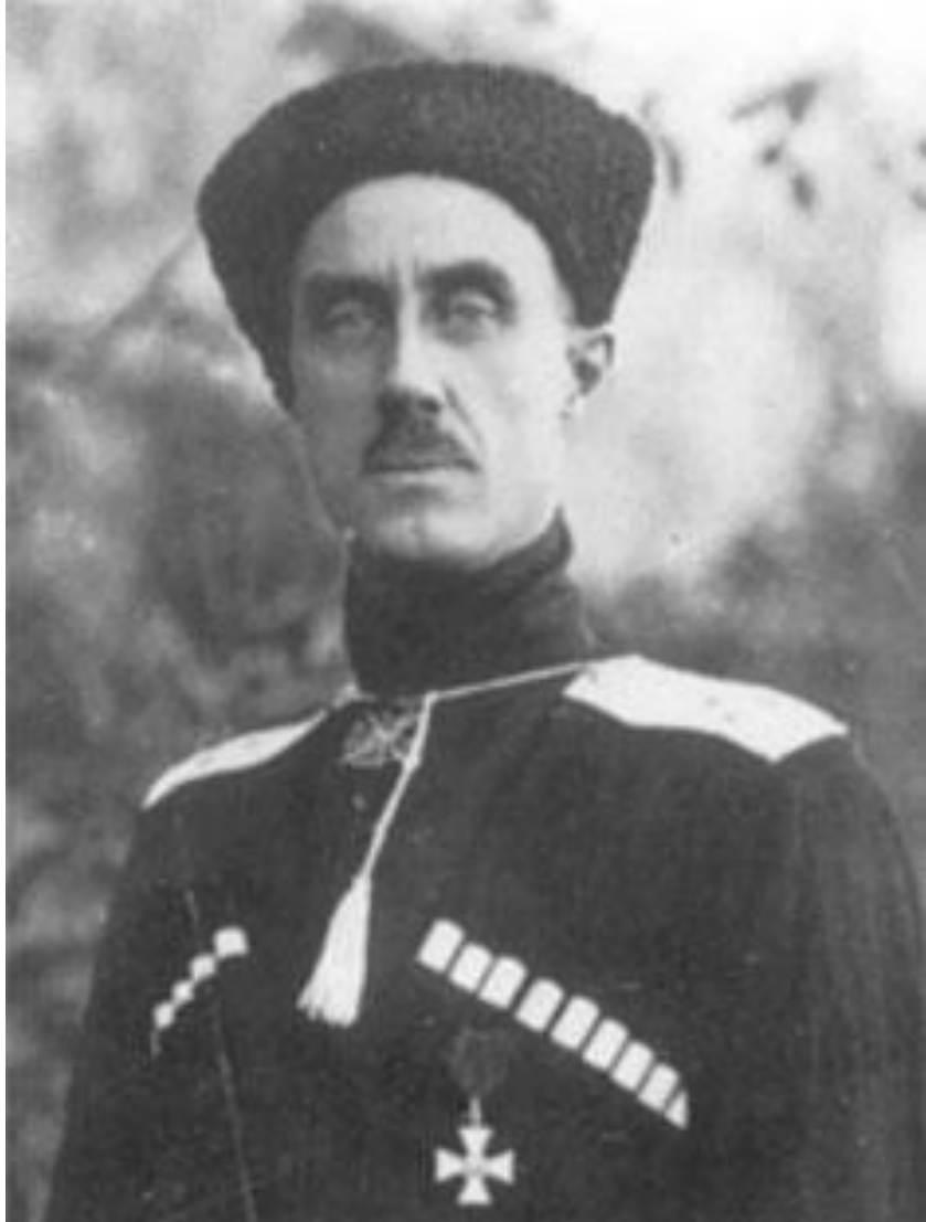
Пётр Николаевич Врангель