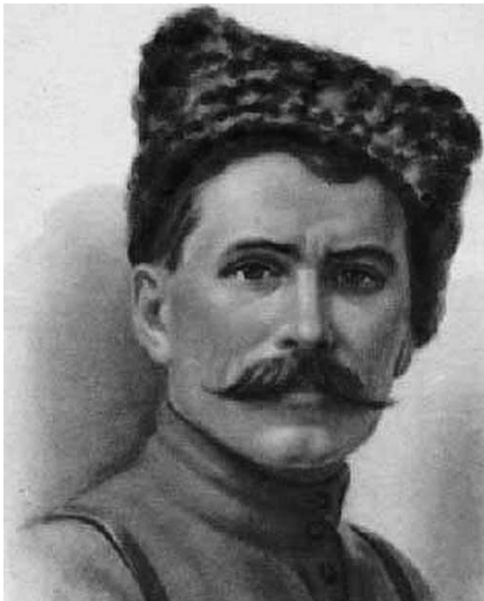
Василий Иванович Чапаев