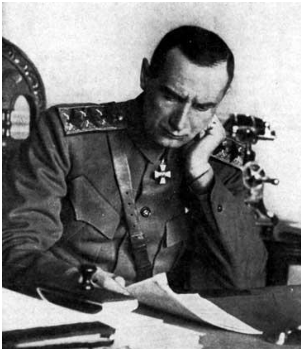
Александр Васильевич Колчак