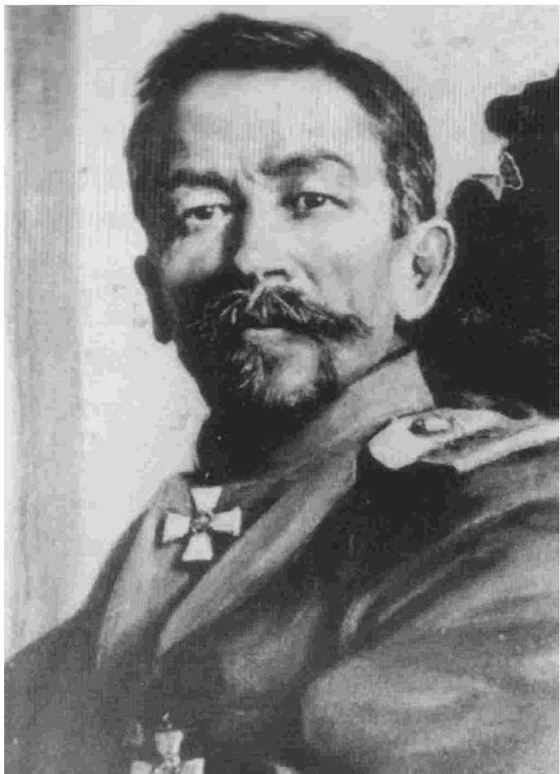
Лавр Георгиевич Корнилов