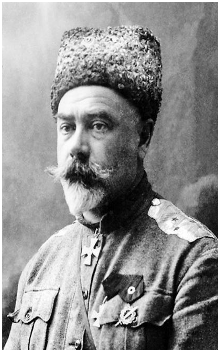
Антон Иванович Деникин