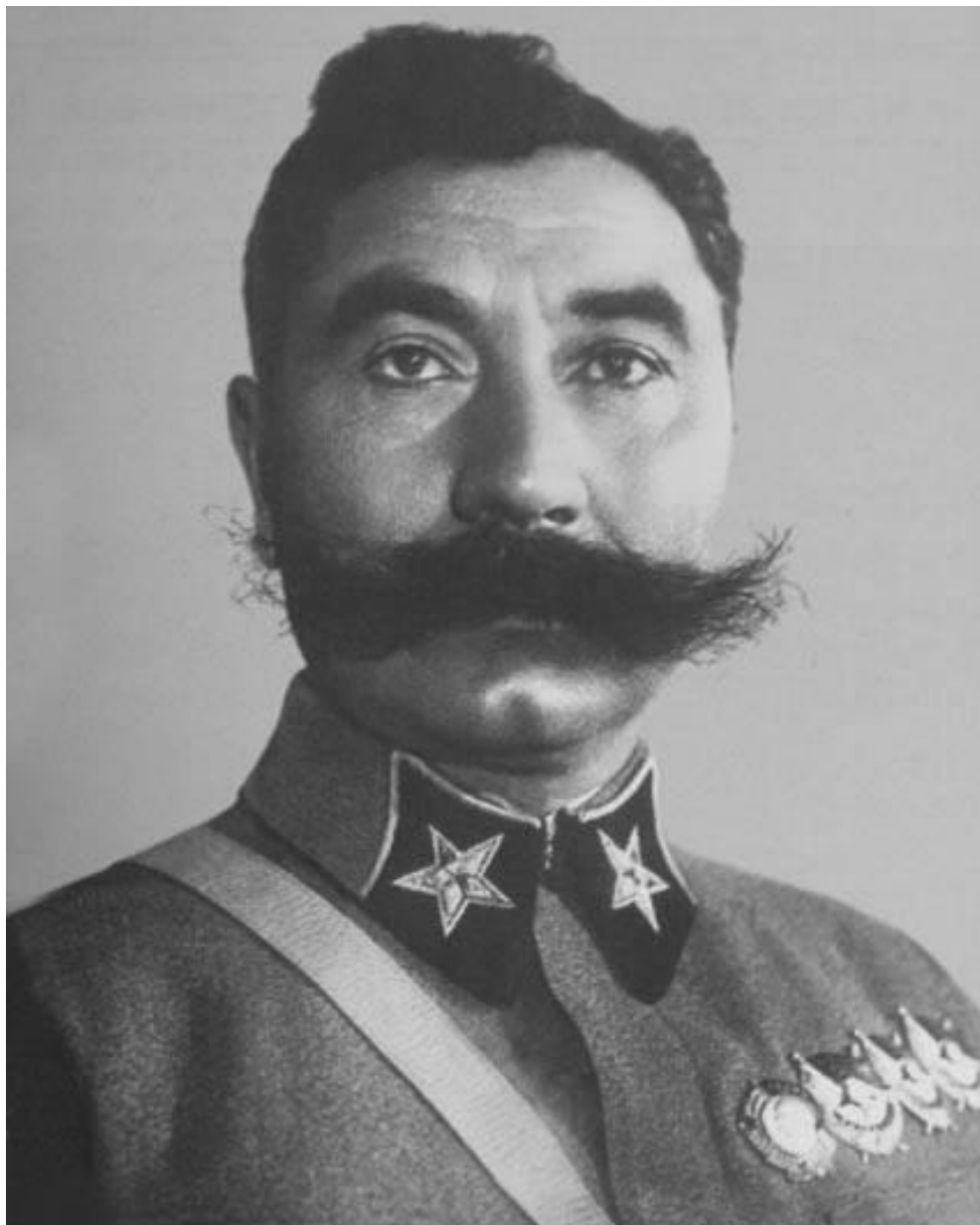
Семён Михайлович Будённый