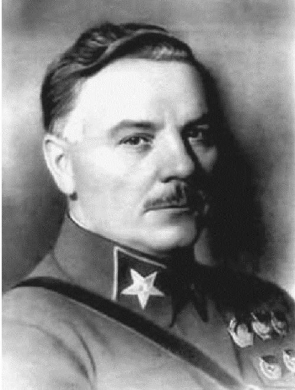
Климент Ефремович Ворошилов