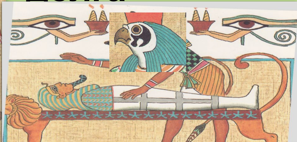
Гор оживляет своего отца Осириса отдав ему свой глаз