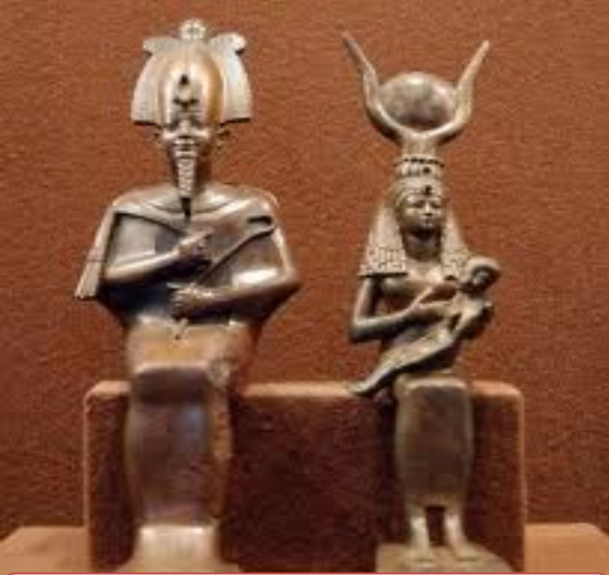
Осирис и Исида – муж и жена