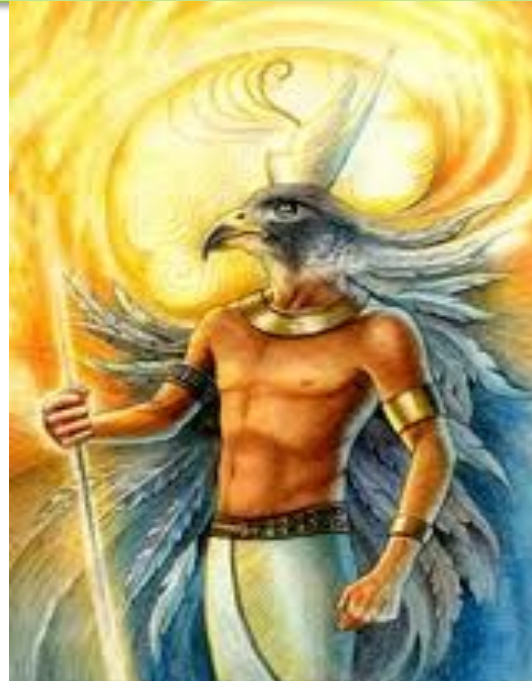
Сын Осириса и Исиды бог ГОР