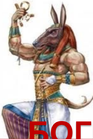
Младший брат Осириса злой бог пустыни СЕТ