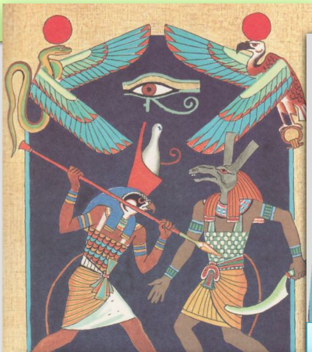
Битва Гора с Сетом