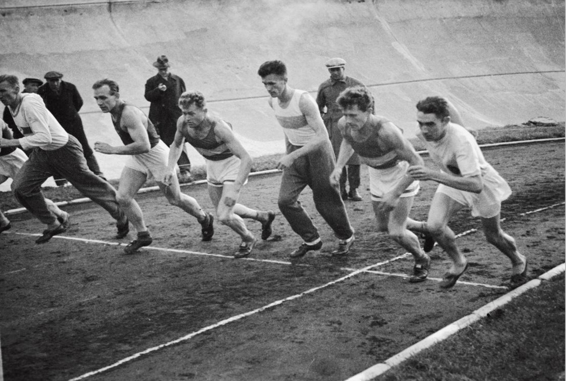
1943г. Чемпионат по легкой атлетике.