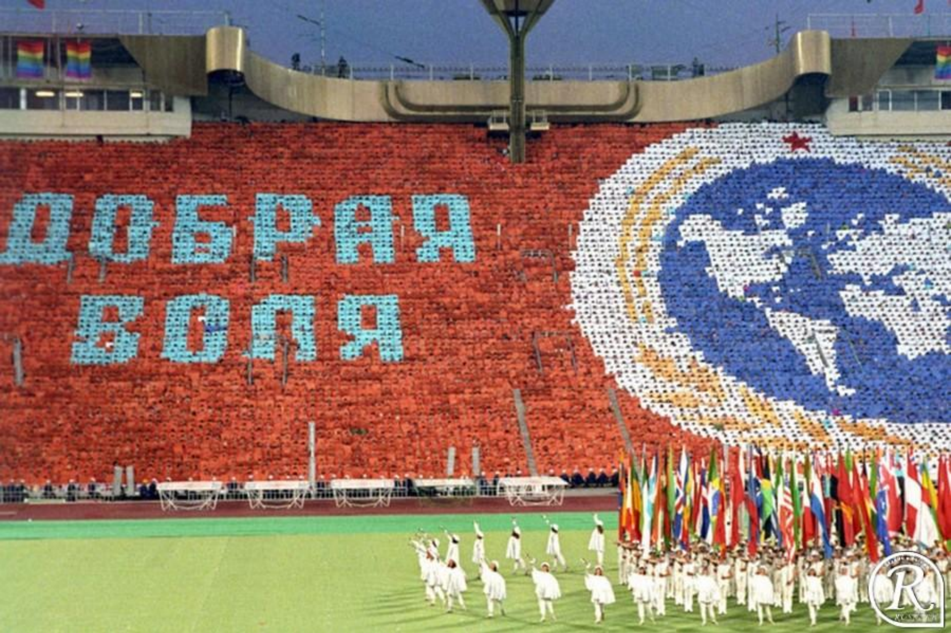
Игры доброй воли ,1984.