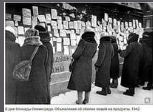
© Дня Блокады Ленинграда. Объявления об обмене вещей на продукты. 1942