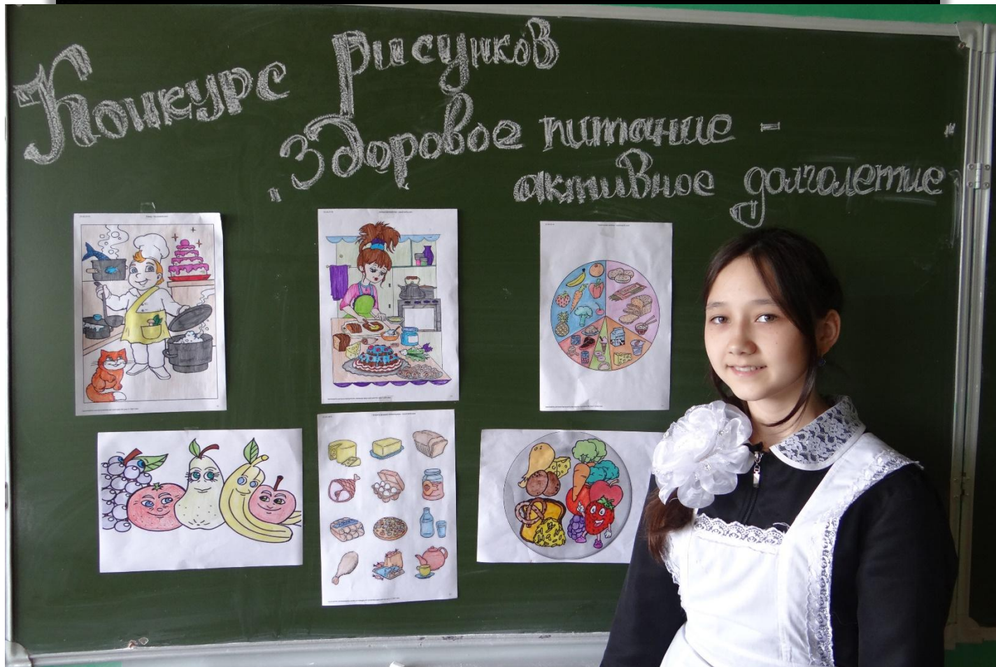
Конкурс рисунков «Здоровое питание- активное долголетие»