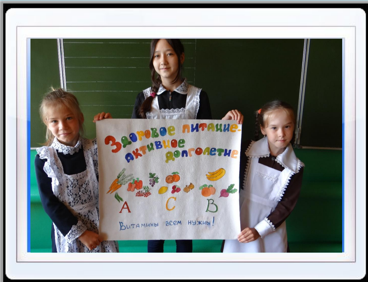
Плакат «Здоровое питание активное долголетие»