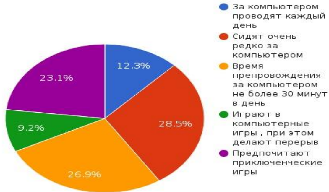
Влияние компьютера на человека