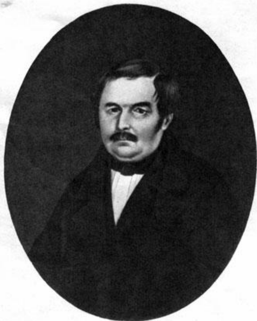
ОТЕЦ ПИСАТЕЛЯ, В. А. ГОГОЛЬ-ЯНОВСКИЙ. Работа неизвестного художника.