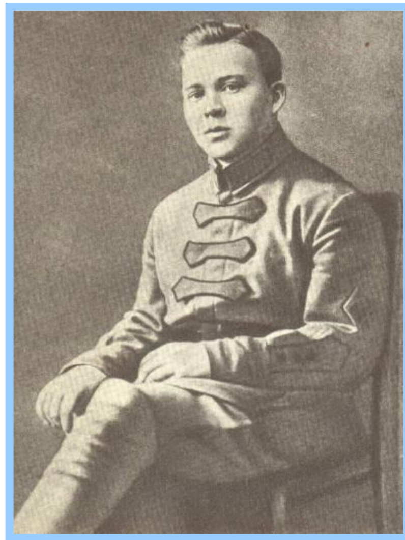
А. Гайдар – комбат ЧОН. 1922 год

Где бы ни служил Аркадий, он везде проявляет себя как инициативный, творчески мыслящий, одарённый человек