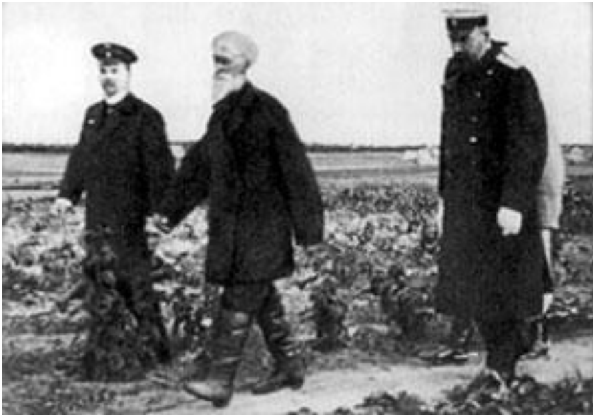
П.А.Столыпин осматривает хуторские огороды близ Москвы в апреле 1910 г