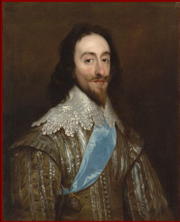
Карл I Стюарт

Стюарты пытались ввести англиканство в Шотландии, но там еще в 16 в. установилось пресвитерианство. В 1640 г. король созвал парламент с целью добиться введения новых налогов для начавшейся войны с Шотландией. Этот парламент работал без перерыва 12 лет и получил название Долгого .