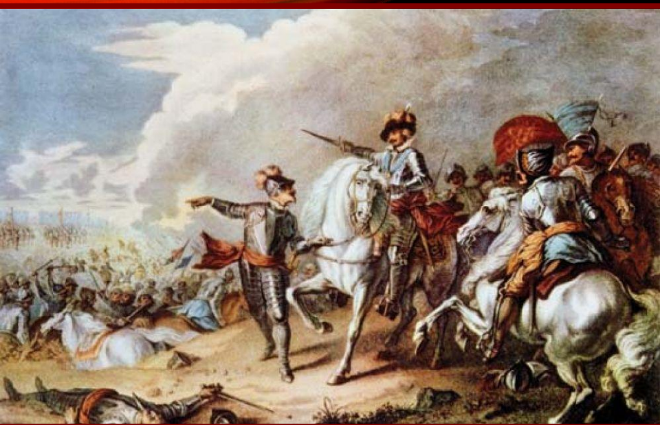
Битва при Нейсби