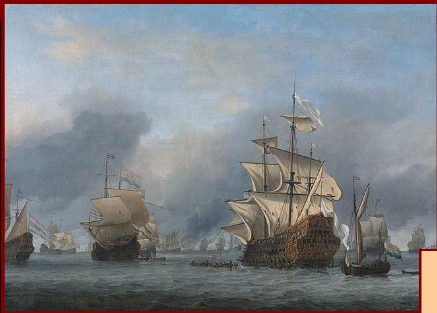
Английские корабли 17 в.

В конце XVI в. в Англии быстрыми темпами развивалась промышленность, страна превратилась в сильную морскую державу, в Америке была основана первая колония – Виргиния. Многие джентри (новые дворяне) и купцы по своему богатству могли соперничать с лордами.