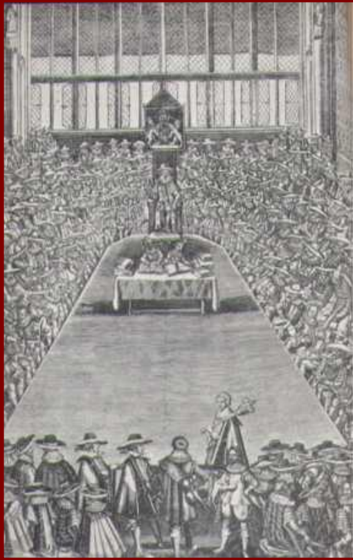
Английский парламент 17 в.