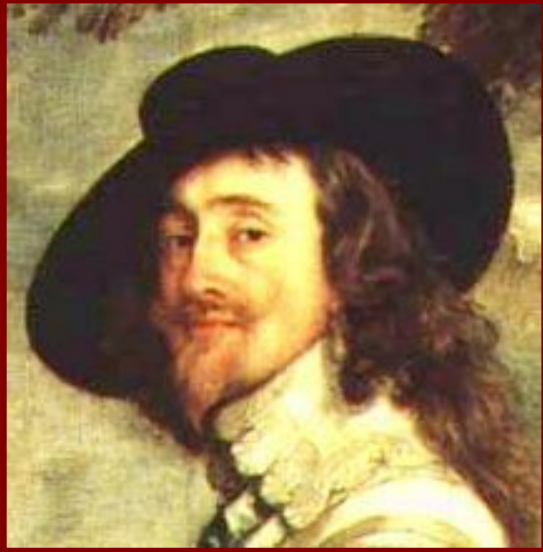
Карл I Стюарт

В 1625 г. королем стал Карл I. Он продолжал политику отца. Король был самолюбив, вспыльчив, неуравновешен и лицемерен. Карл I женился на католичке – французской принцессе Генриетте Марии и при дворе было введено католическое богослужение.