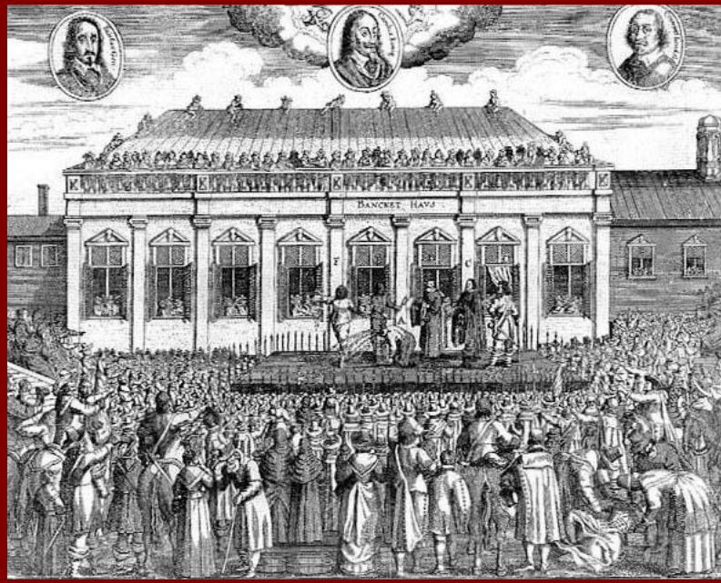
Казнь Карла I

30 января 1649 г. Карл I был казнен. Известие о казни короля волной ужаса прокатилось по всем королевским дворам Европы.