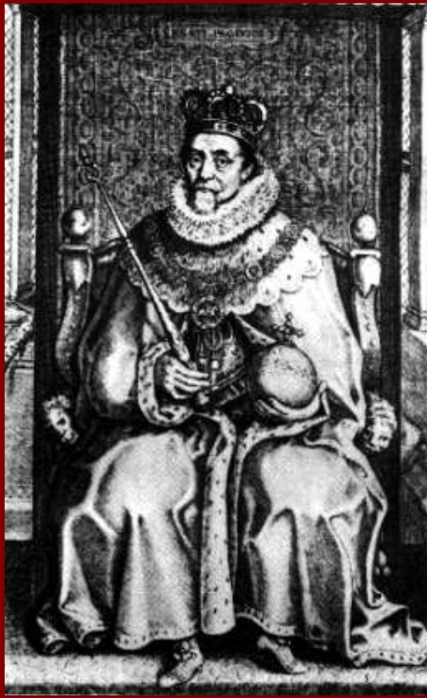
Яков I Стюарт

Король Яков I Стюарт стремился править единолично, не спрашивая мнения парламента. Он защищал англиканскую церковь и притеснял пуритан, вынужденных массово переселяться в Америку.