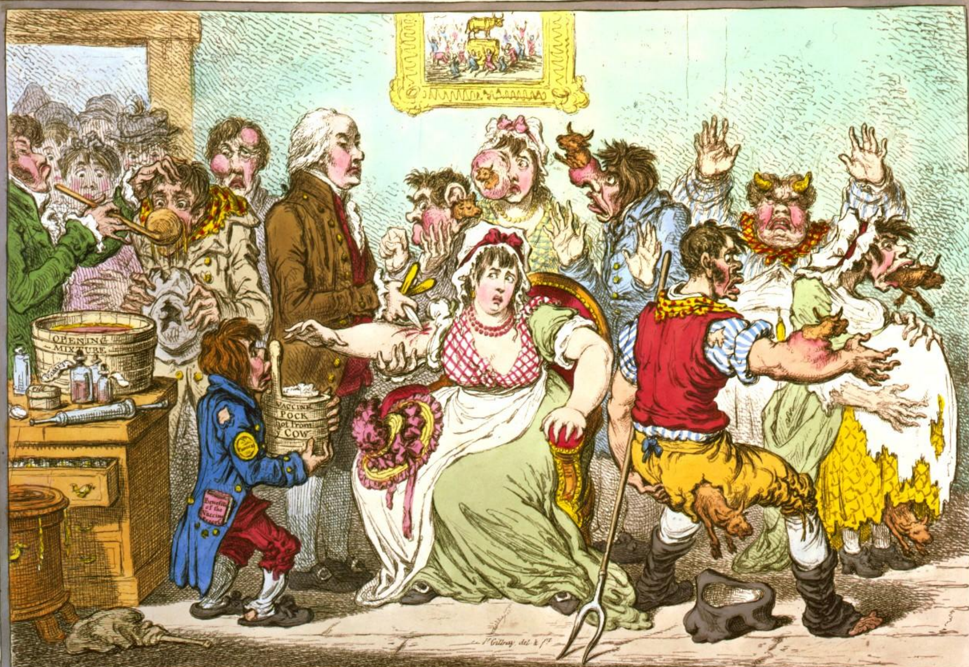
The Cow-Pock — or — the Wonderful Effects of the New Inoculation! — Vide. the Publications of the Anti-Vaccine Society. Pub. June 18, 1854. by H. Humphrey, 51, James Street.