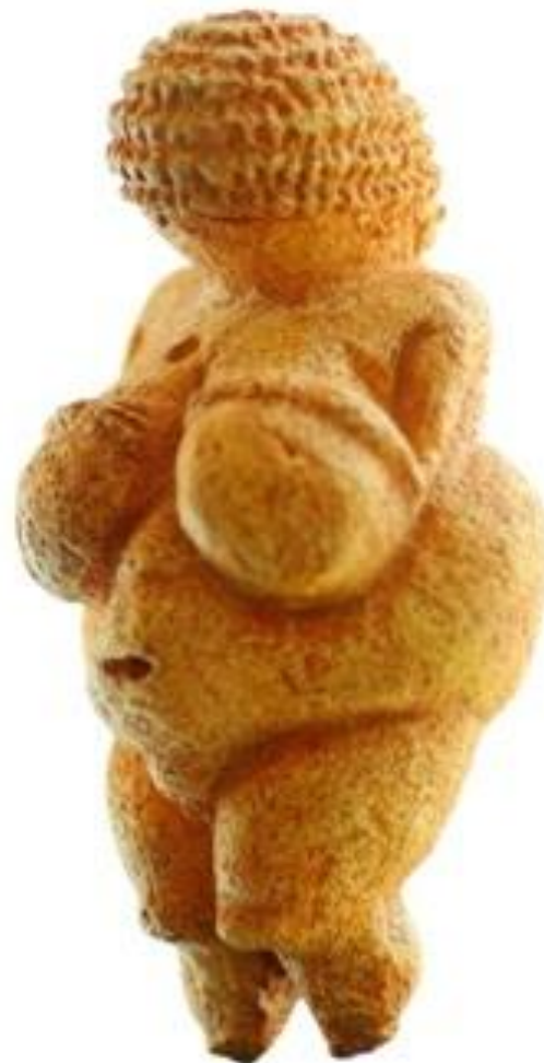
Женская статуэтка из Виллендорфа. Верхний палеолит