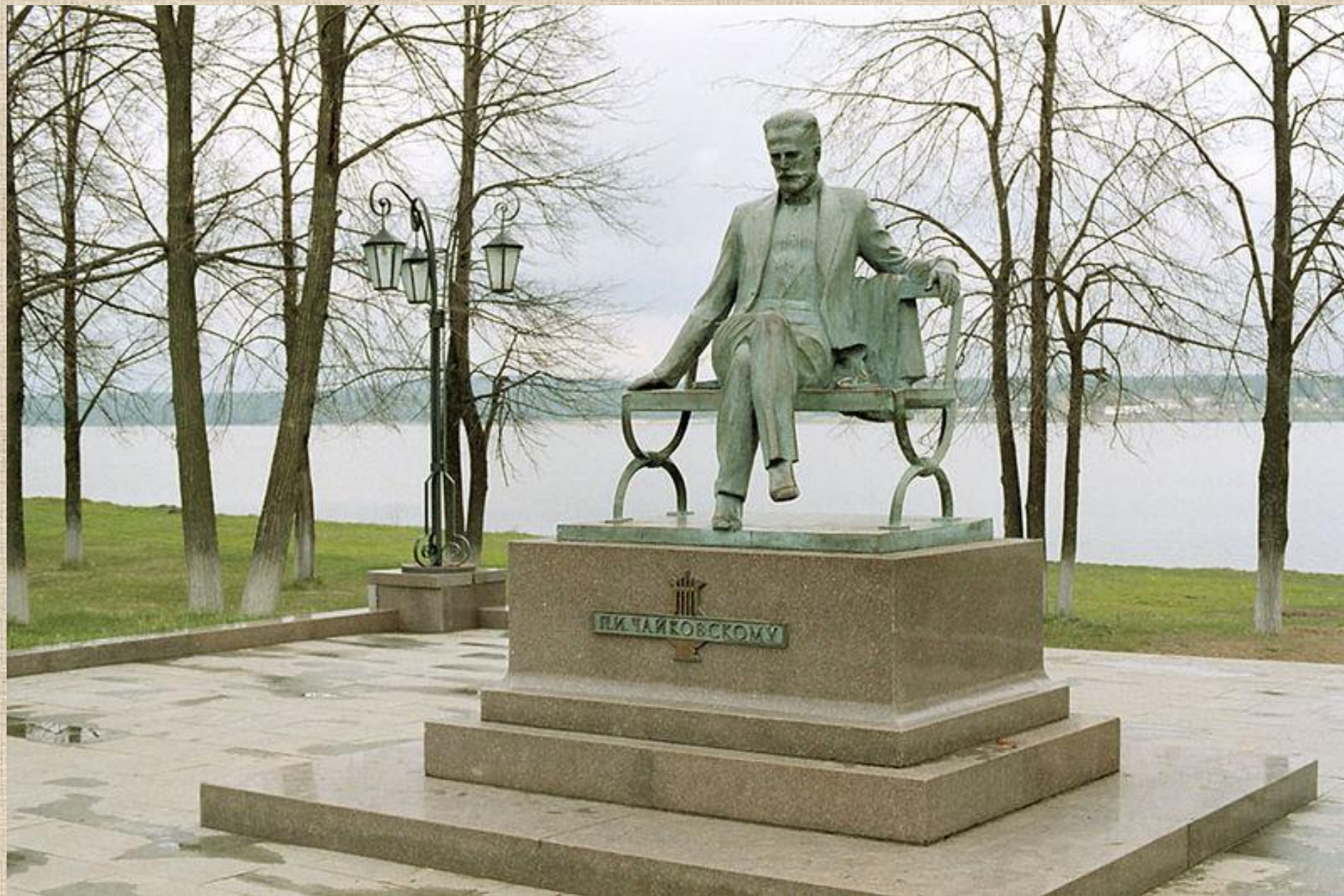
Памятник Петру Чайковскому в Воткинске.