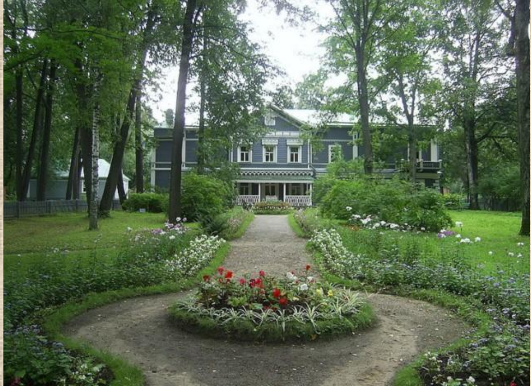
дом в Клину Петра Ильича Чайковского,

"Сколько было восторгу, и все это не мне, а голубушке России", - записал он в своем дневнике после одного из концертов в Праге. В 1891 году он совершил