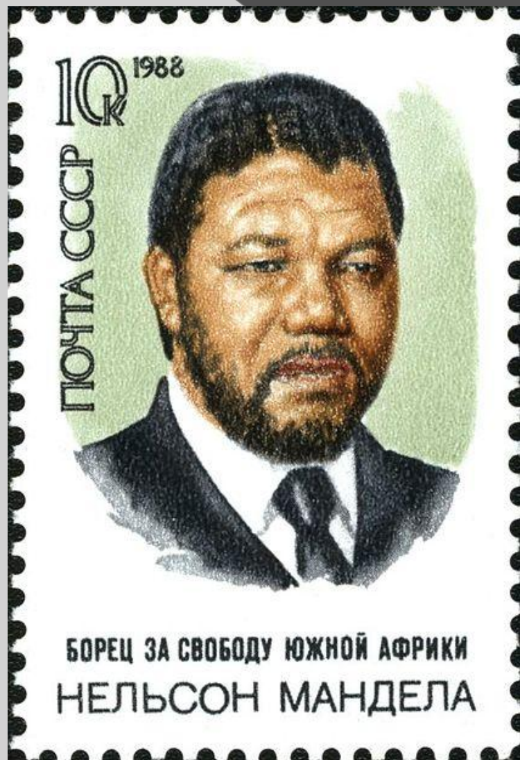
ПОЧТОВАЯ МАРКА СССР, 1988ГОД.