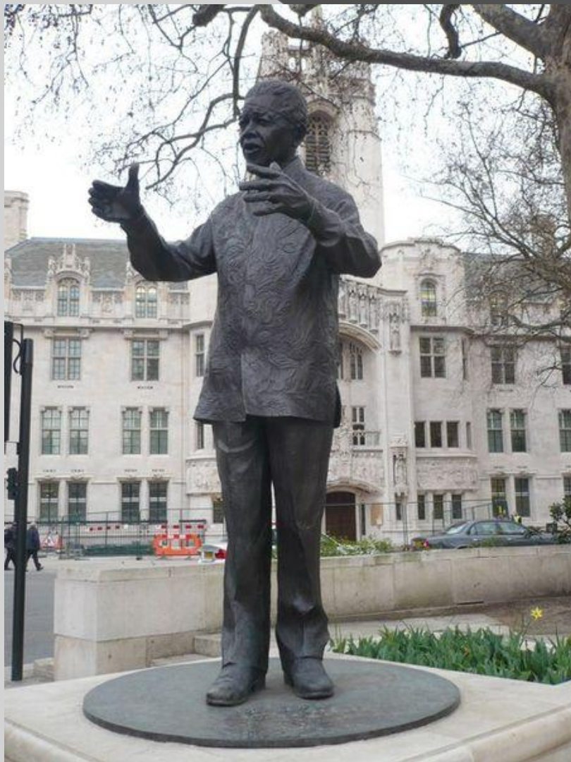
Памятник Нельсону Манделе в Лондоне