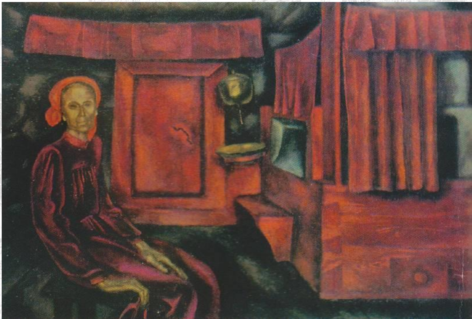
Репродукция картины В.Е.Попкова «Старость», 1969 г.