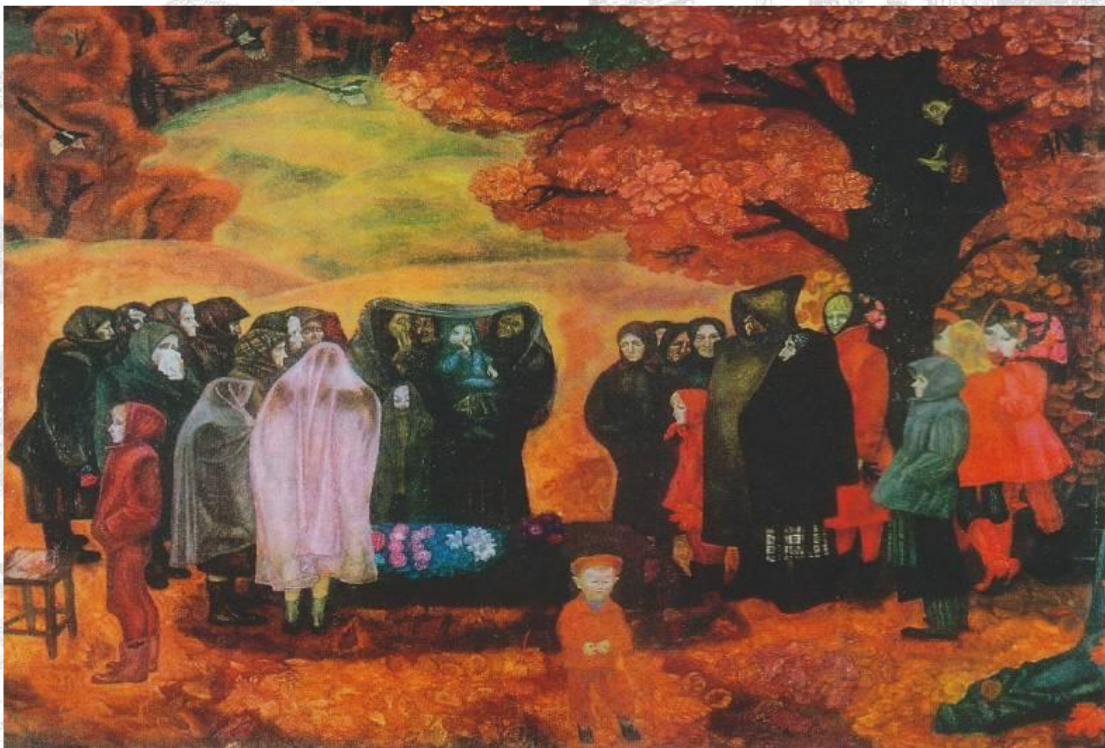
Репродукция картины В.Е.Попкова «Хороший человек была бабка Анисья», 1973 г.