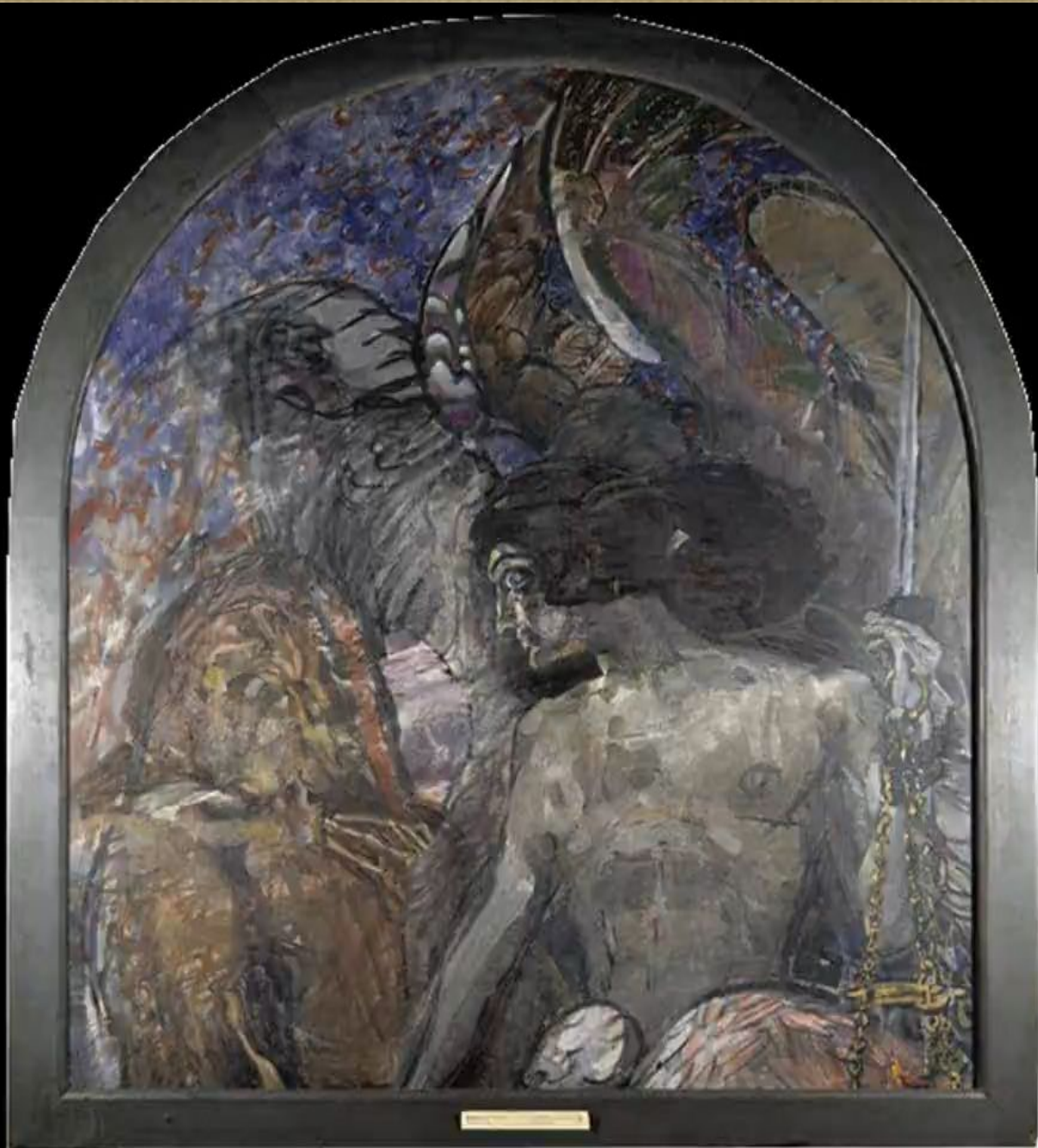
Small, illegible text label at the bottom center of the painting.